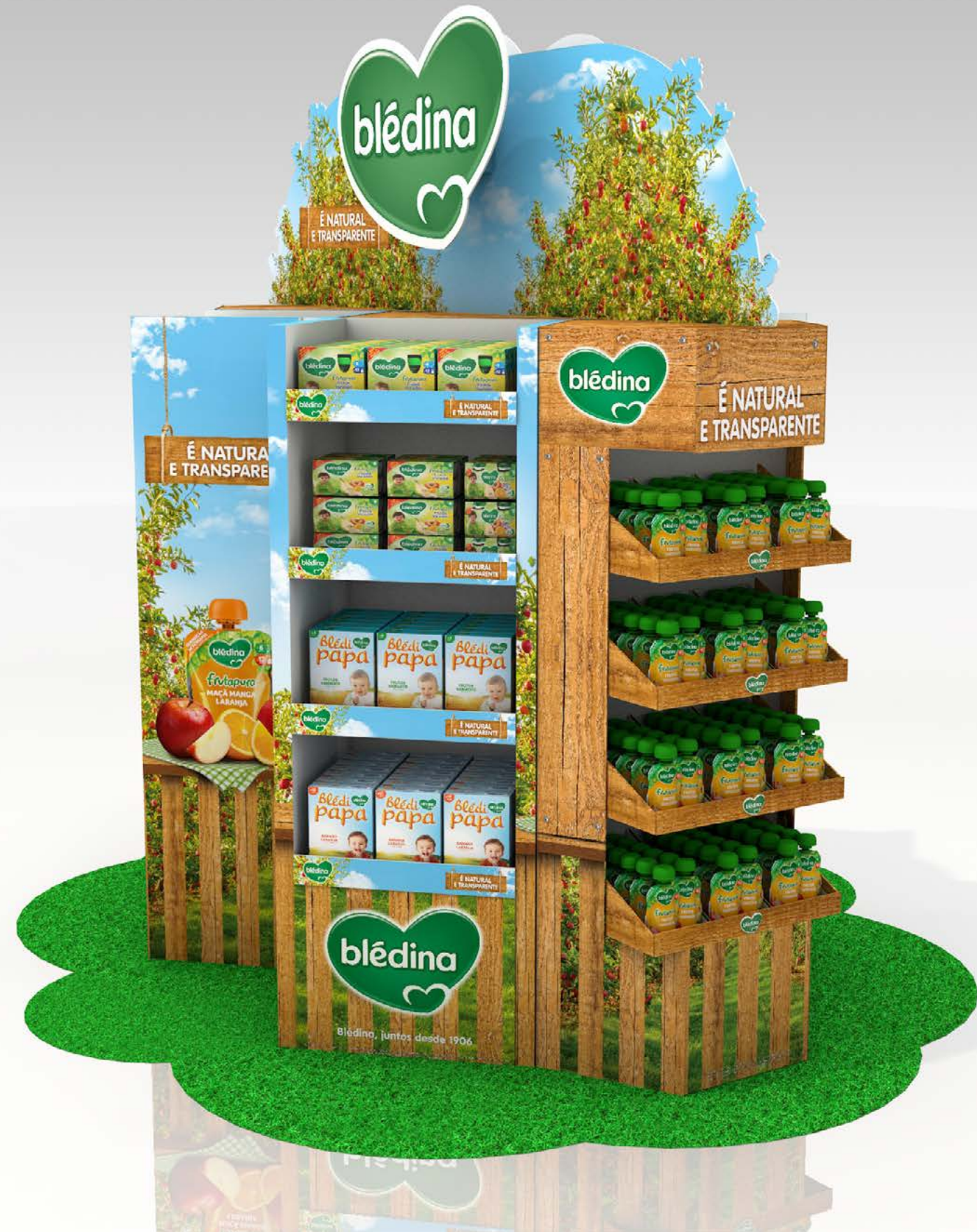
PROJETO Feira do Bebê Blédina_Exposito e Ilha