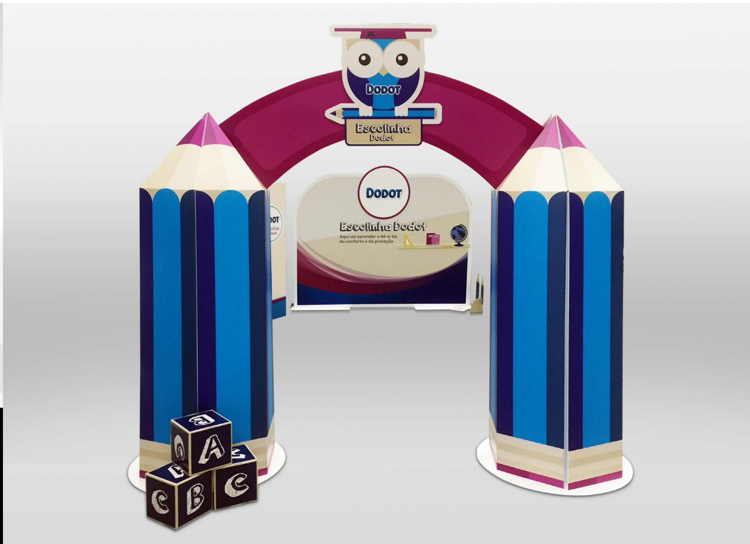
PROJETO Expositores e Espaços Vários