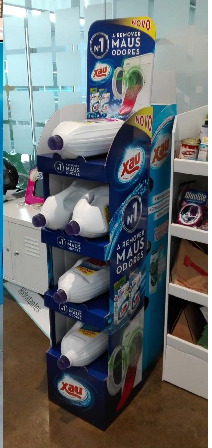
PROJETO Expositores Vários