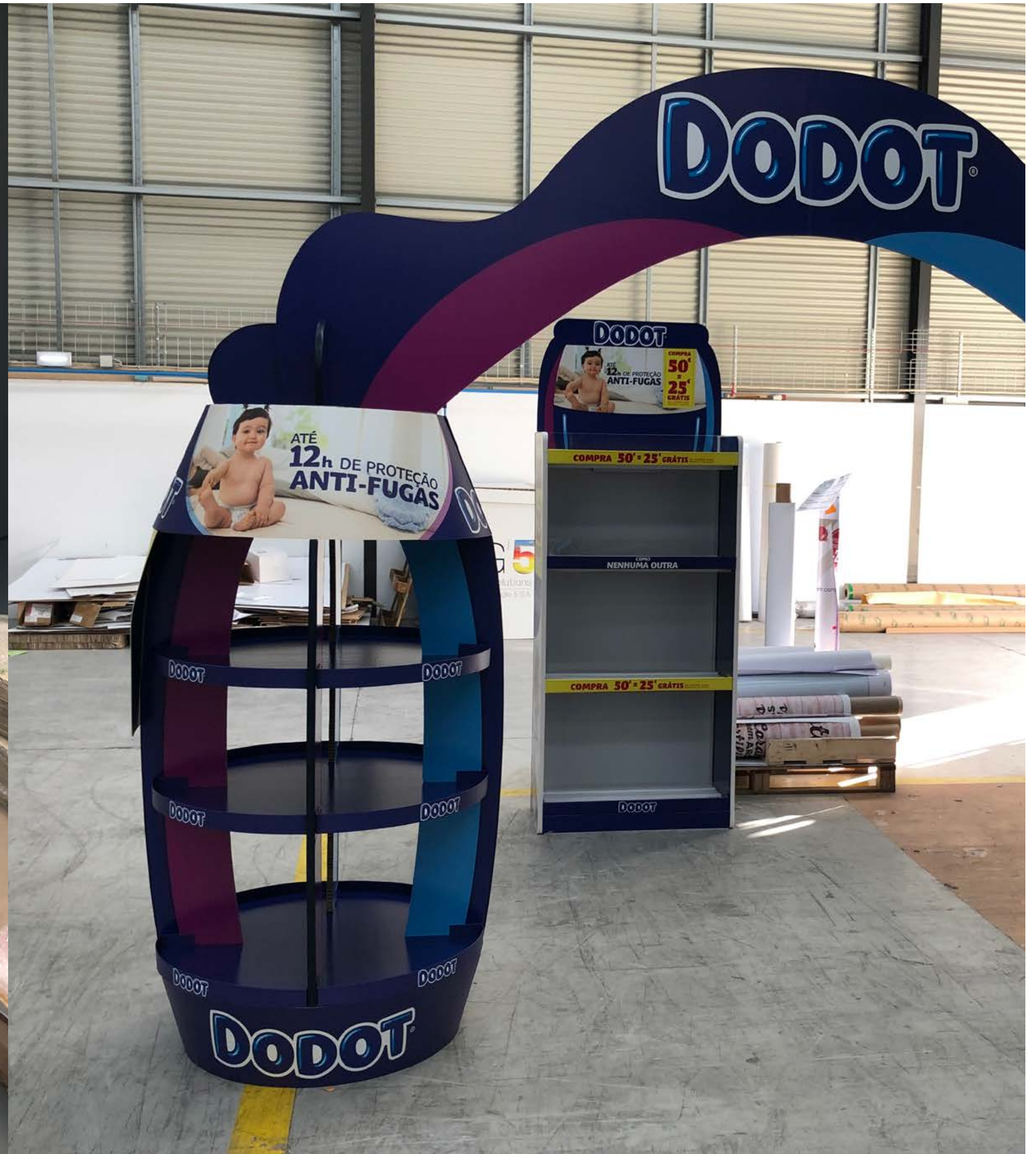
PROJETO Expositores Nestlé e Dodot