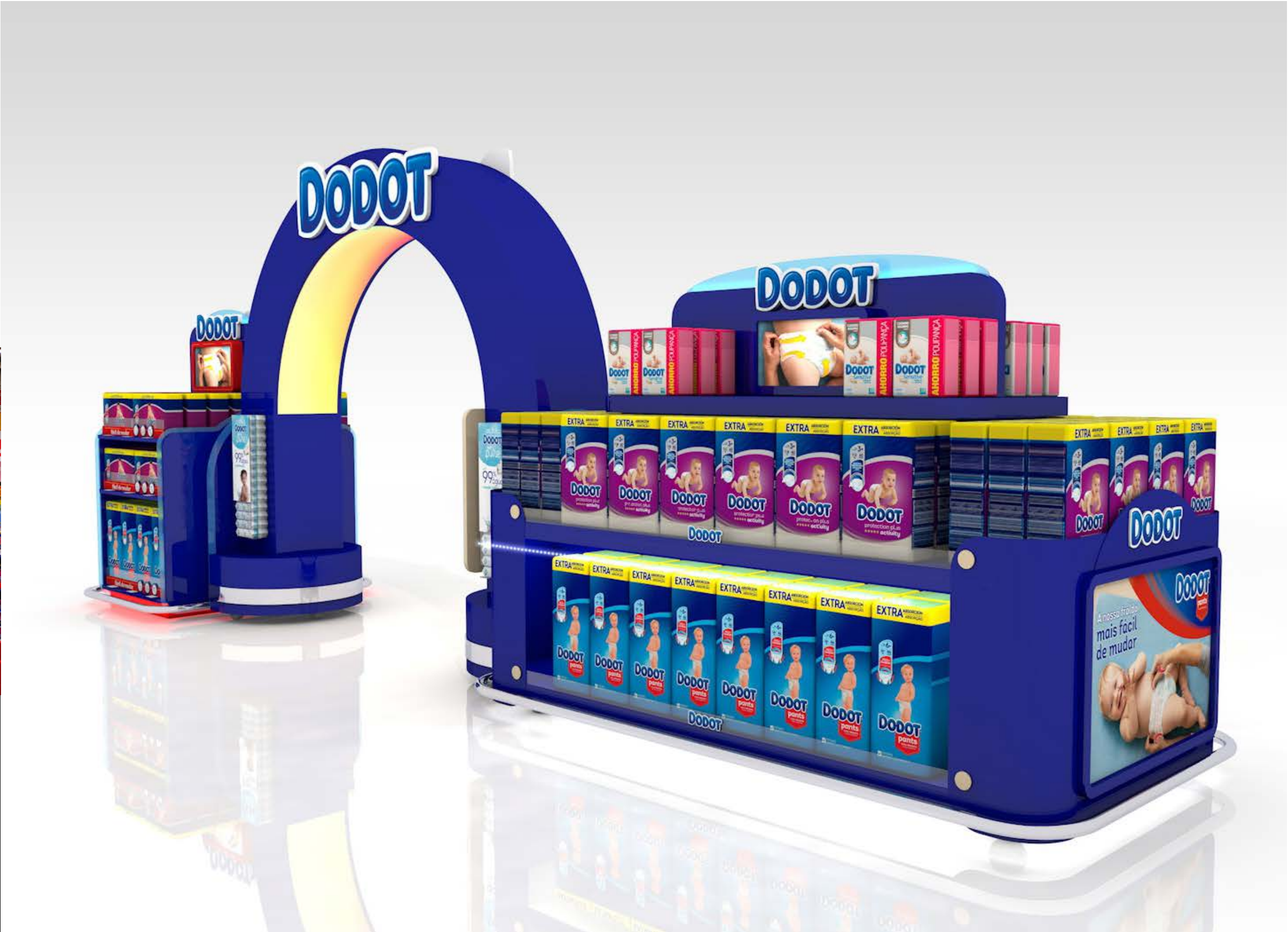
PROJETO Pórtico e Ilha Dodot