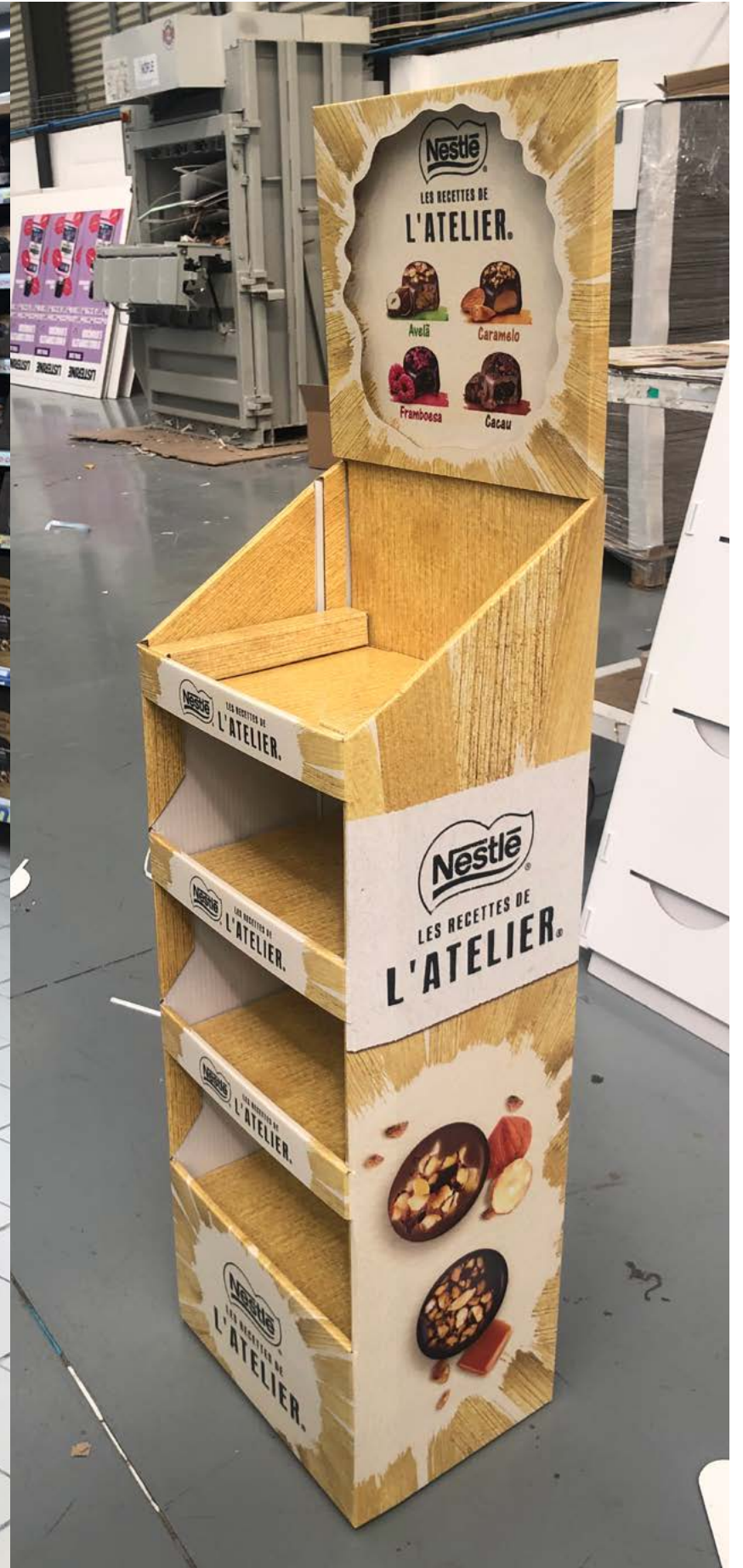
PROJECTO Campanha Nestlé Natal