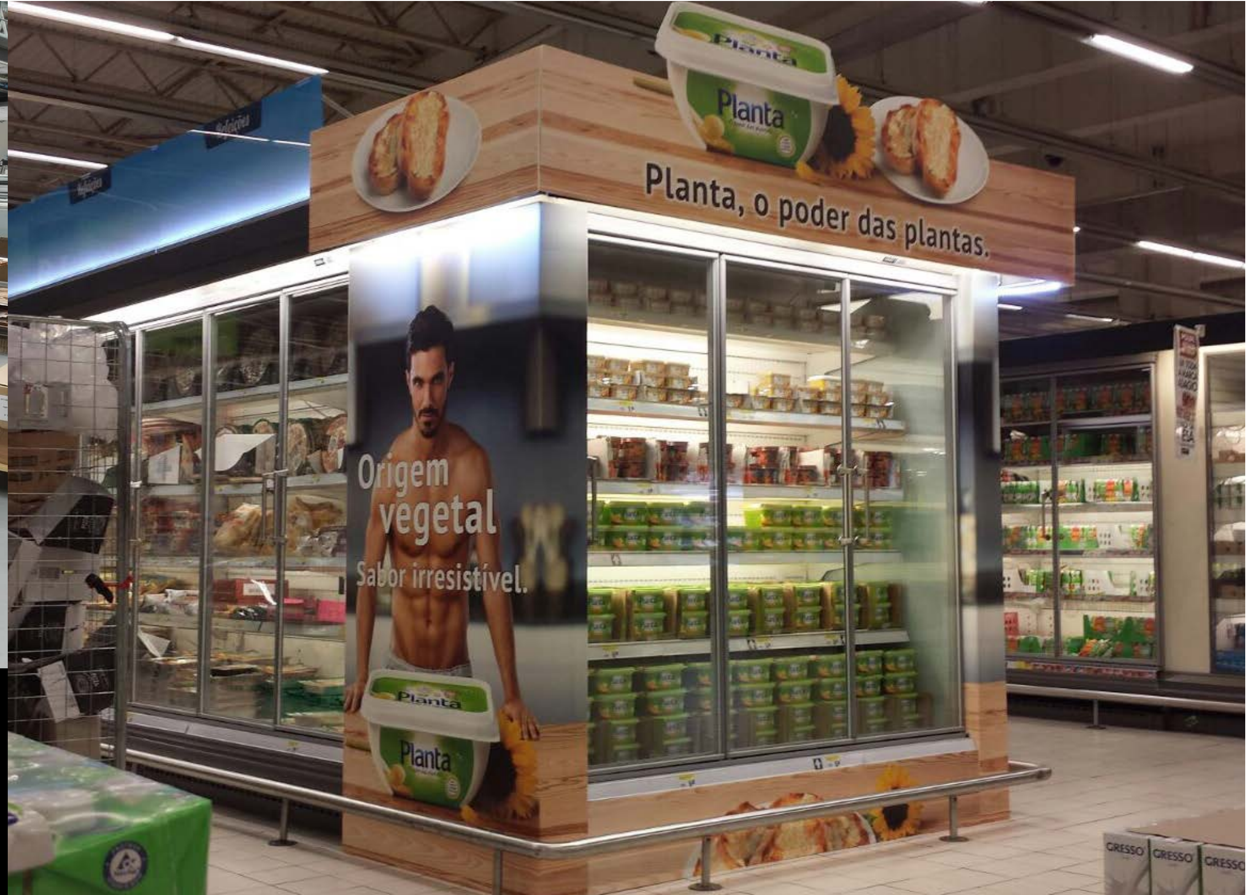
PROJETO Expositor Eristoff e Topo de Frio Planta