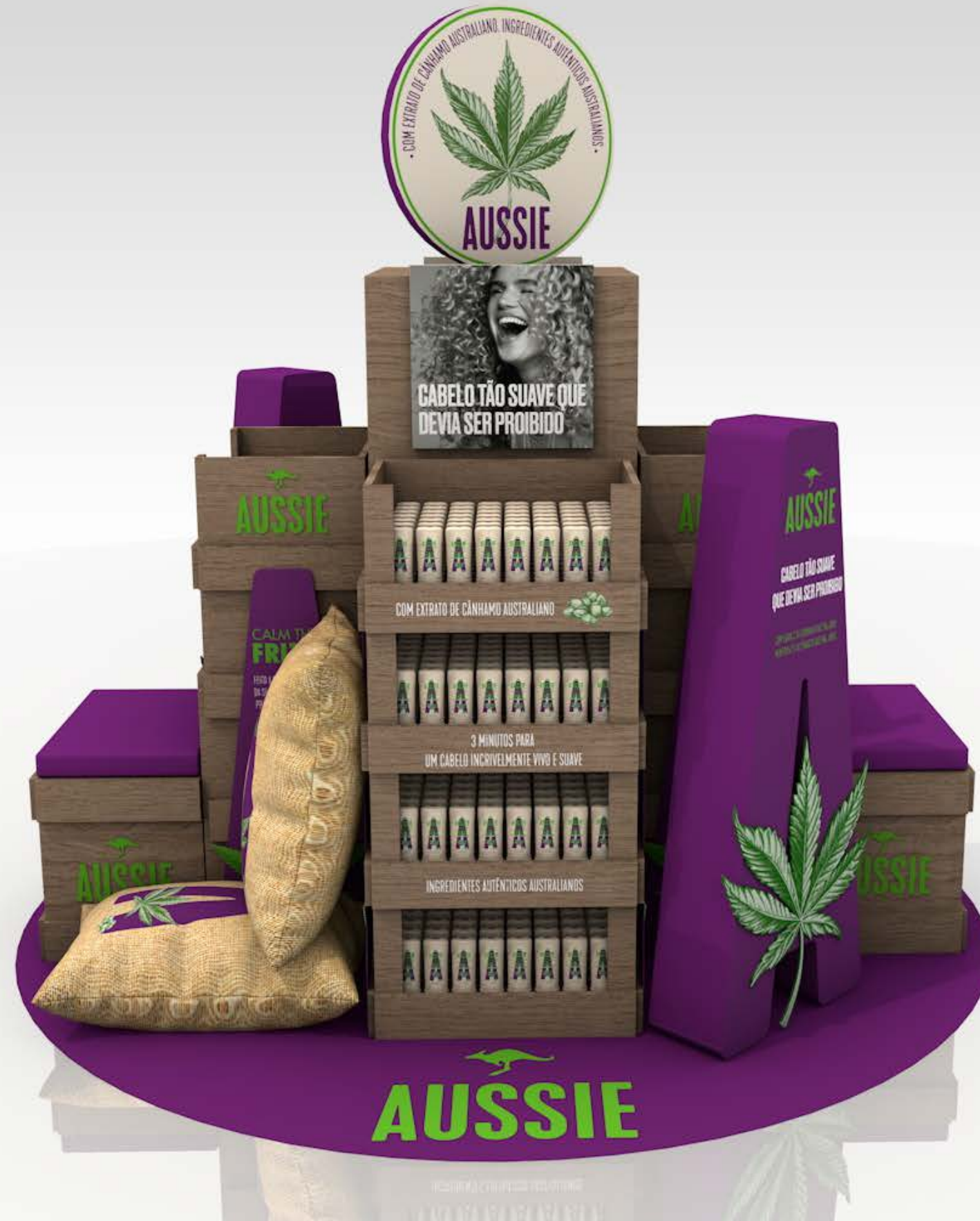
PROJETO Espaço Wow