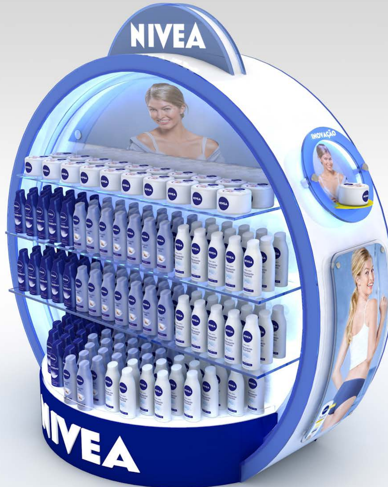
PROJETO Expositores Nivea