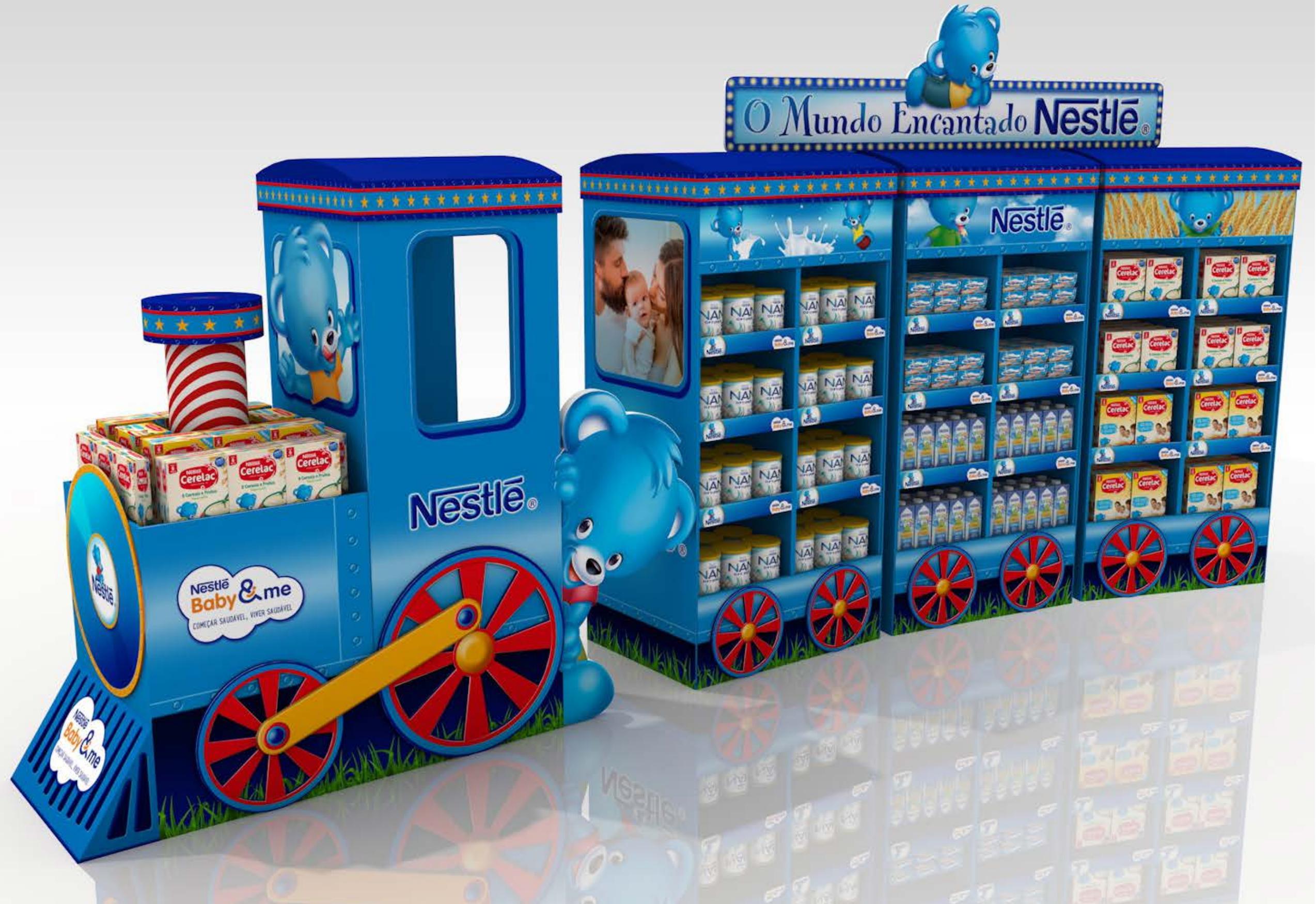
PROJETO Nestlé Feira do Bebê