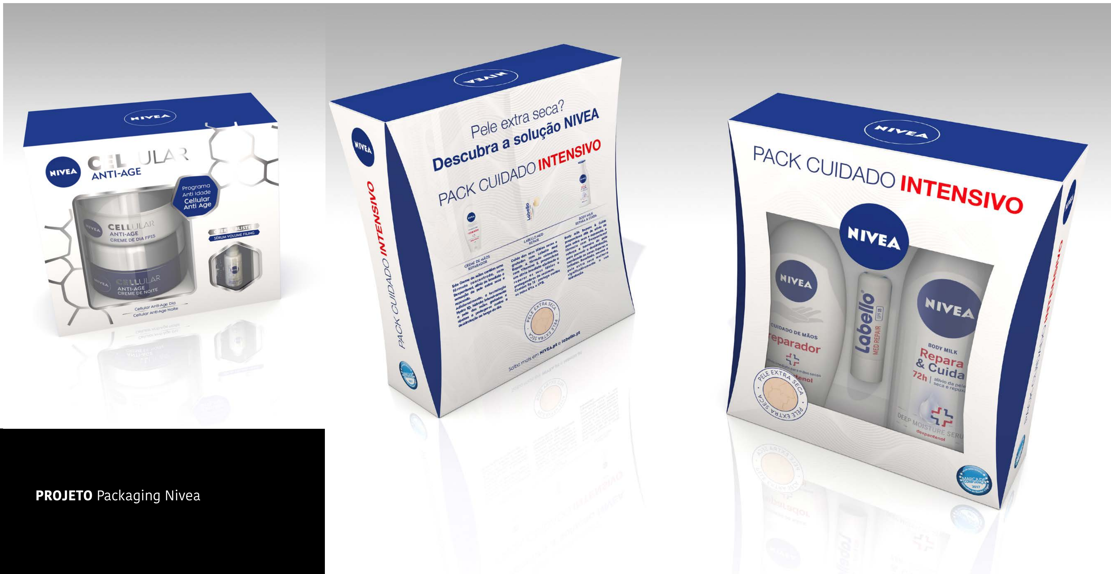
PROJETO Packaging Nivea