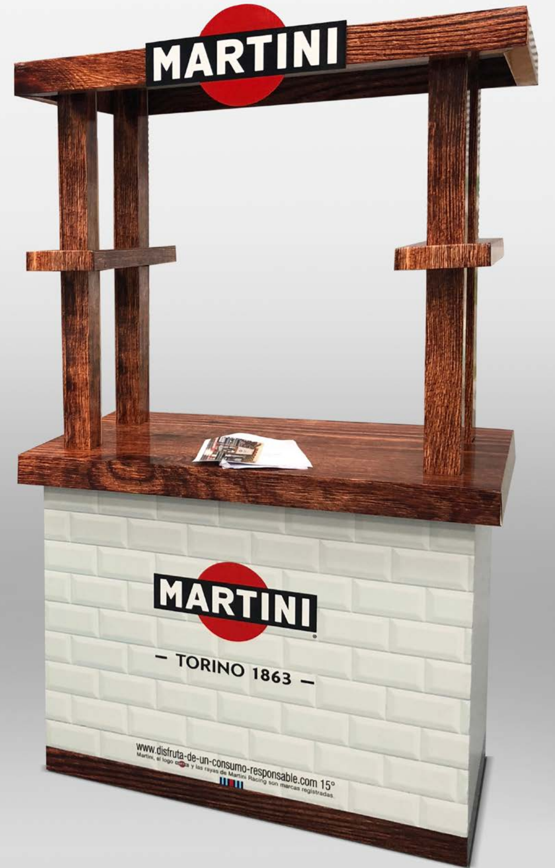
PROJETO Expositores William Lawsons e Martini + Bancada Martini