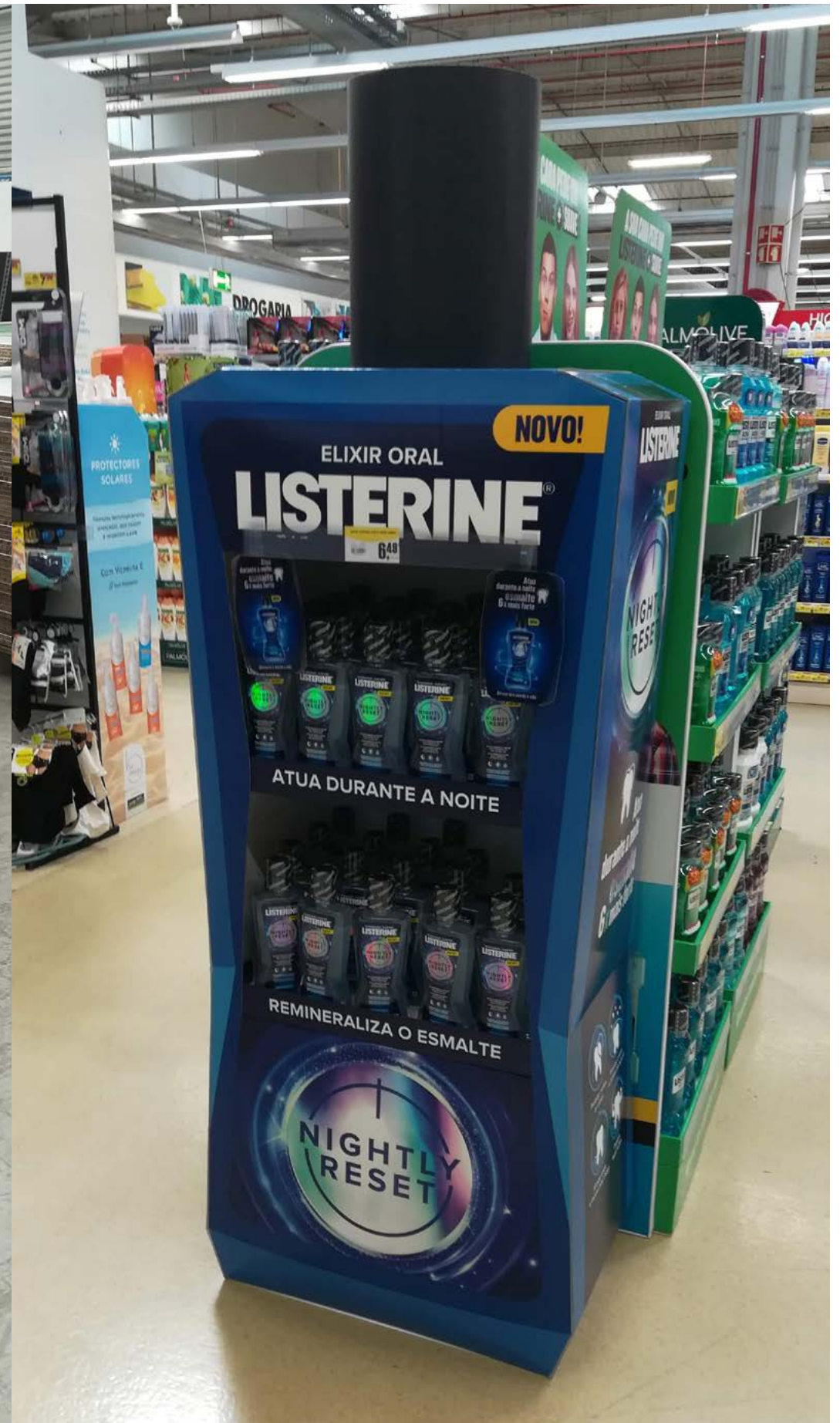
PROJETO Expositores Listerine