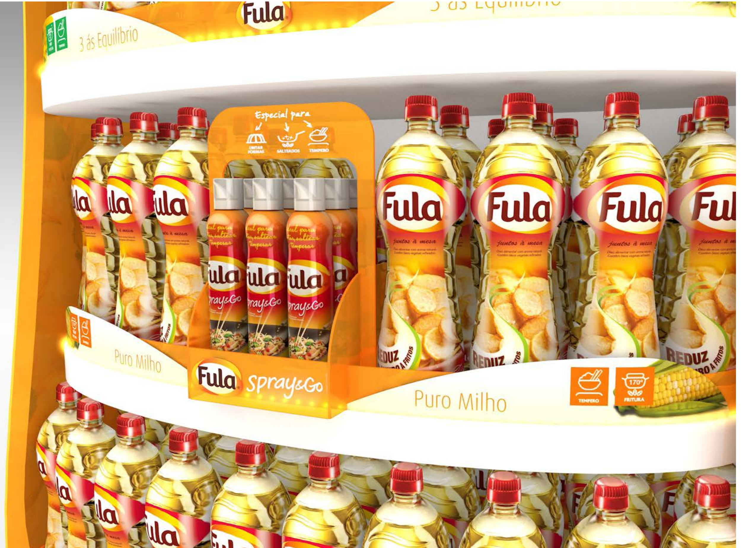
PROJETO Expositor Permanente Fula