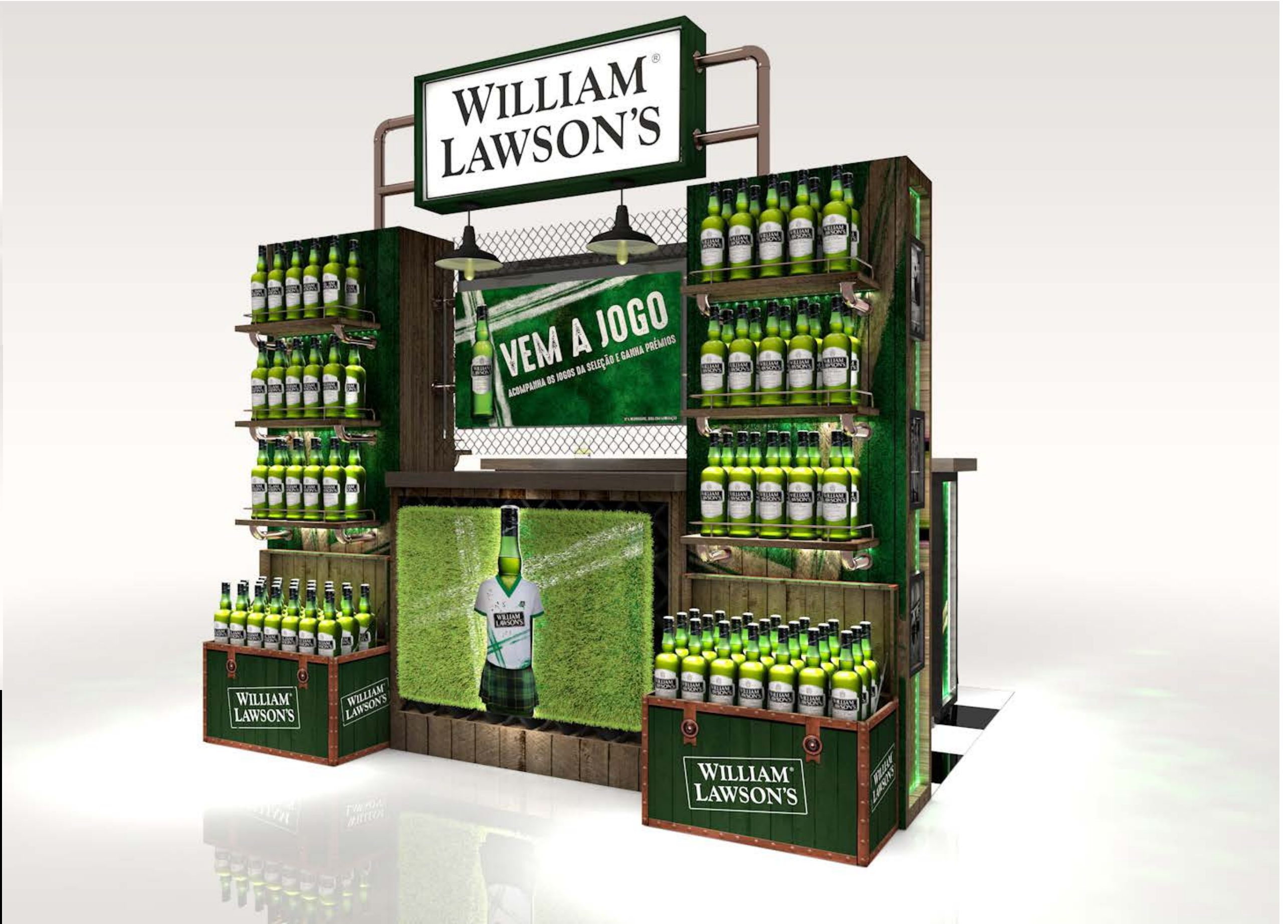
PROJETO Bar William Lawsons