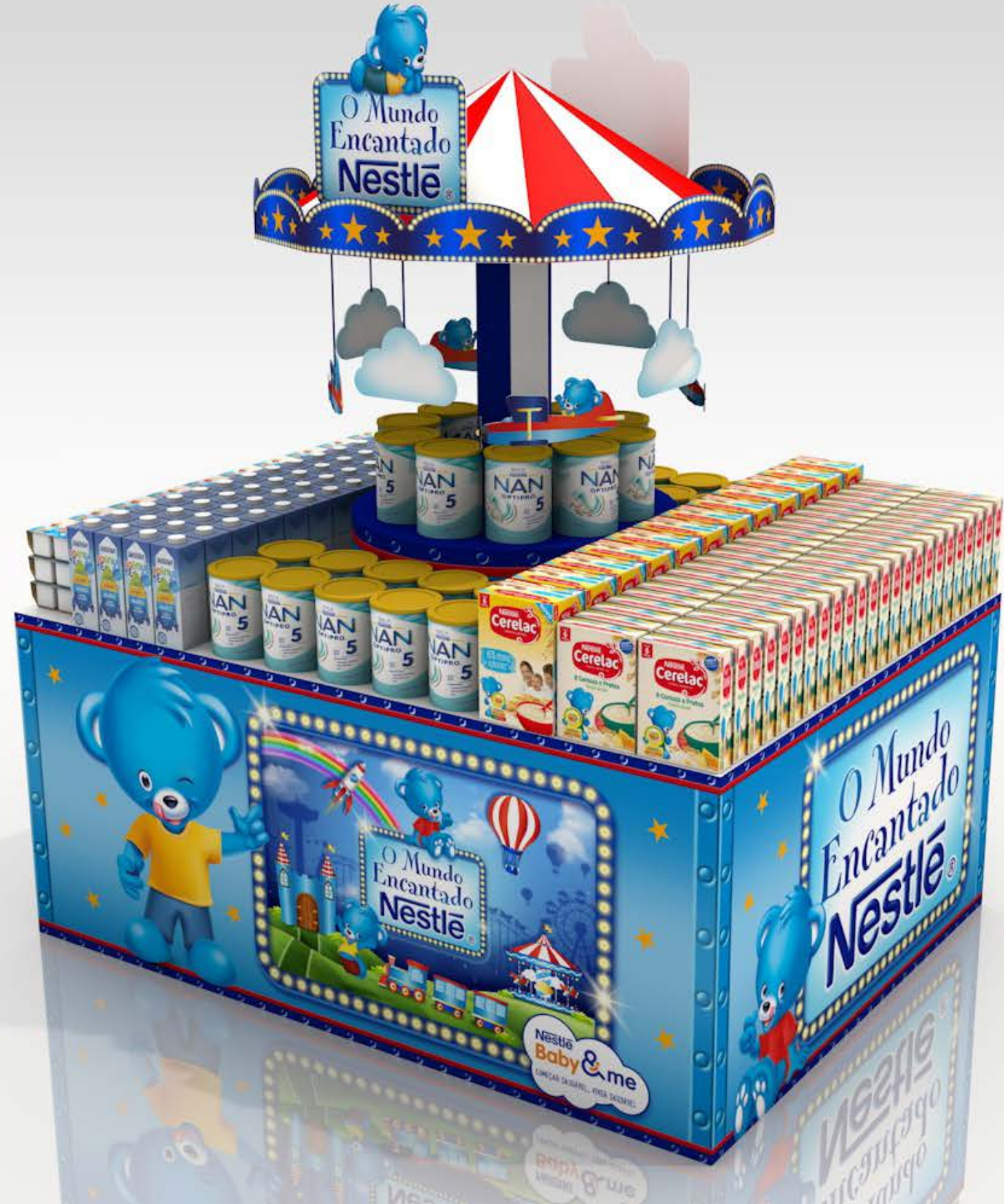
PROJETO Nestlé Feira do Bebê