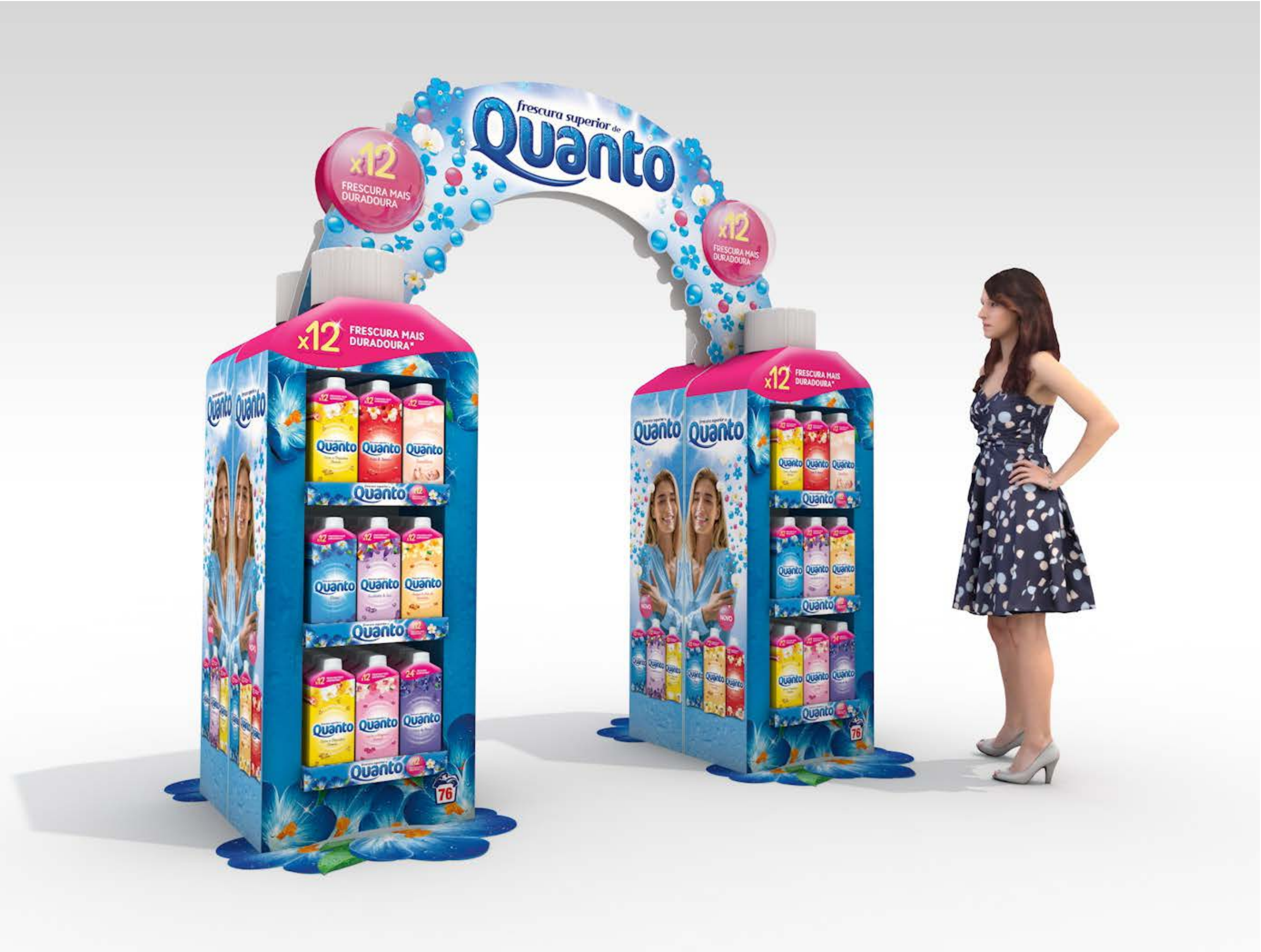
PROJETO Ilha Quanta