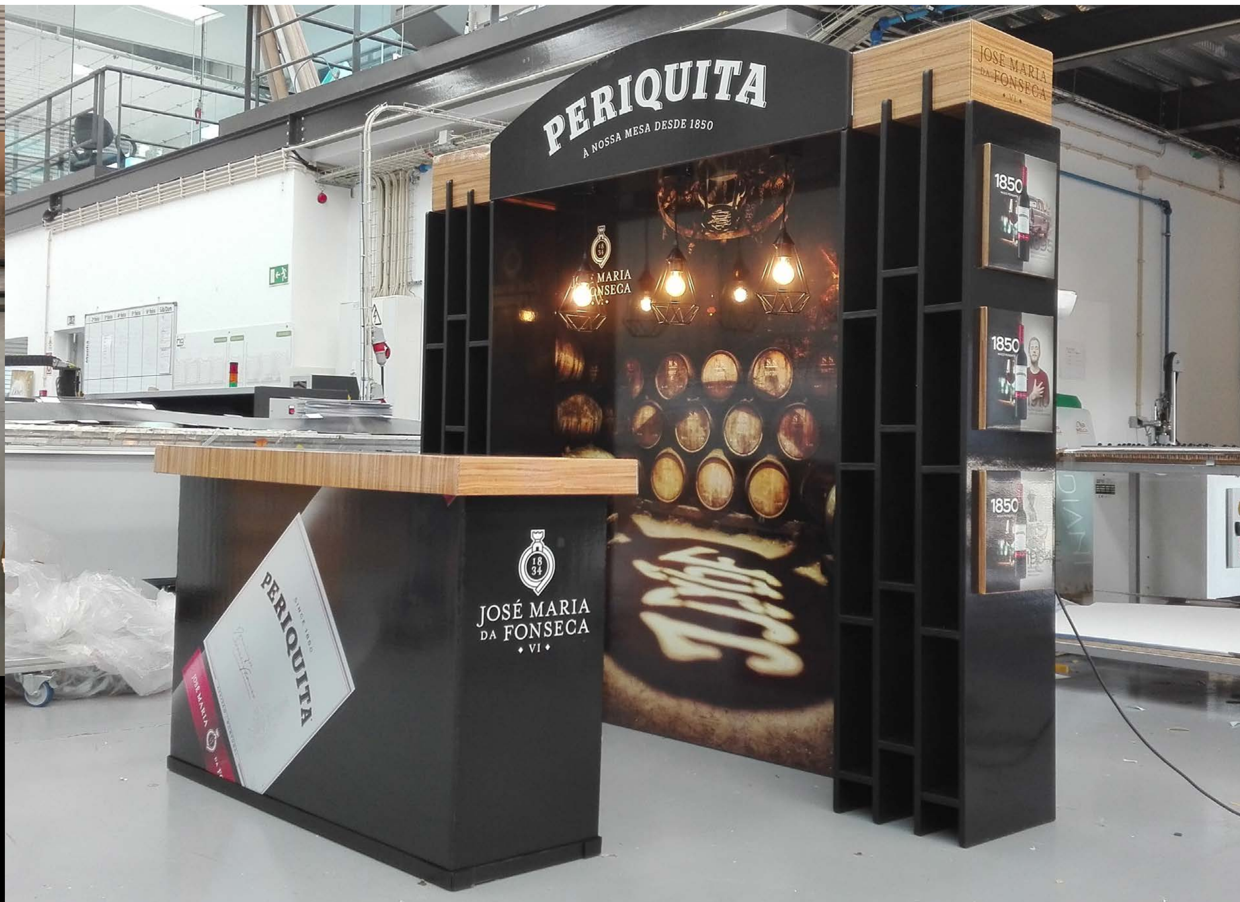
PROJETO Expositor Dove e Stand Periquita