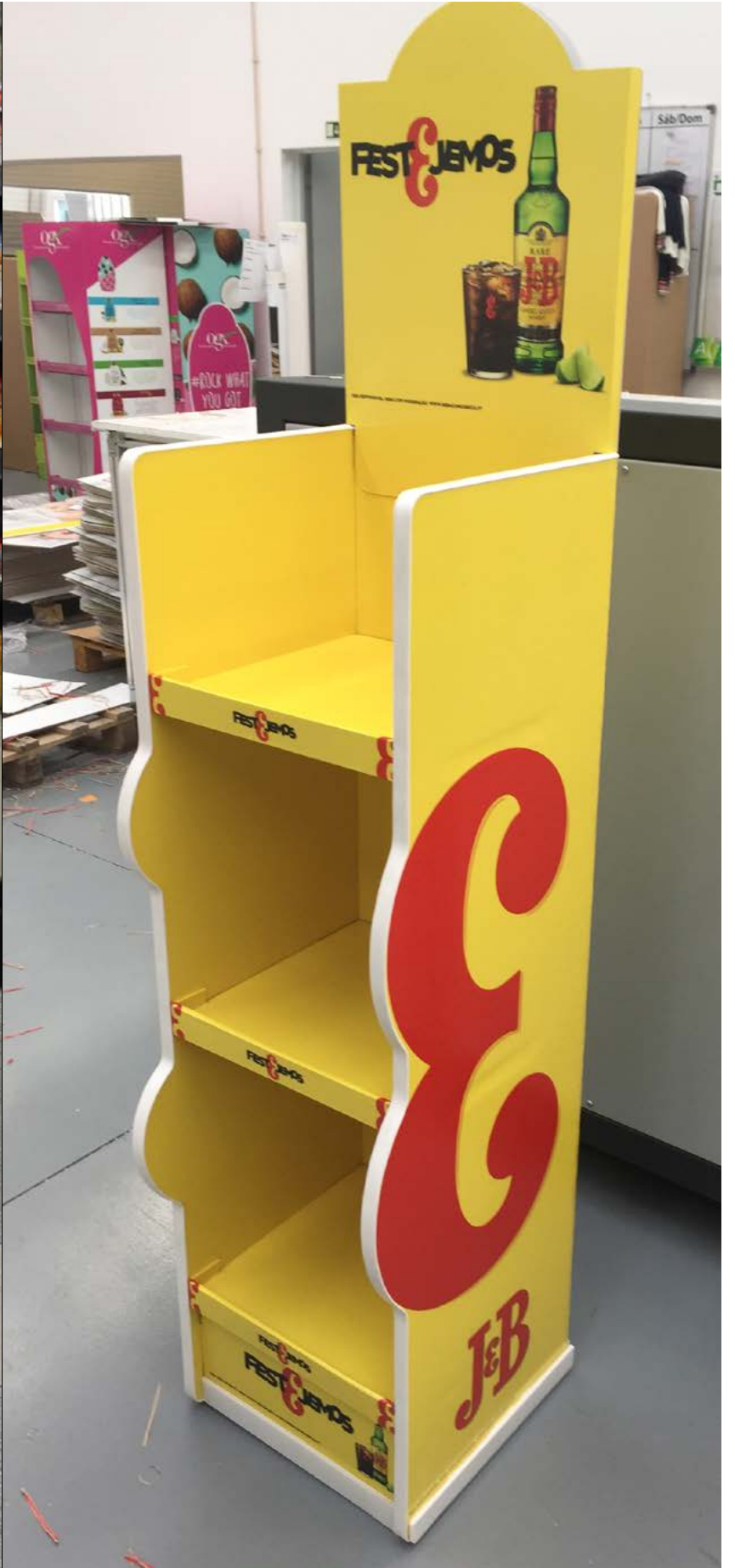
PROJECTO Expositores vários