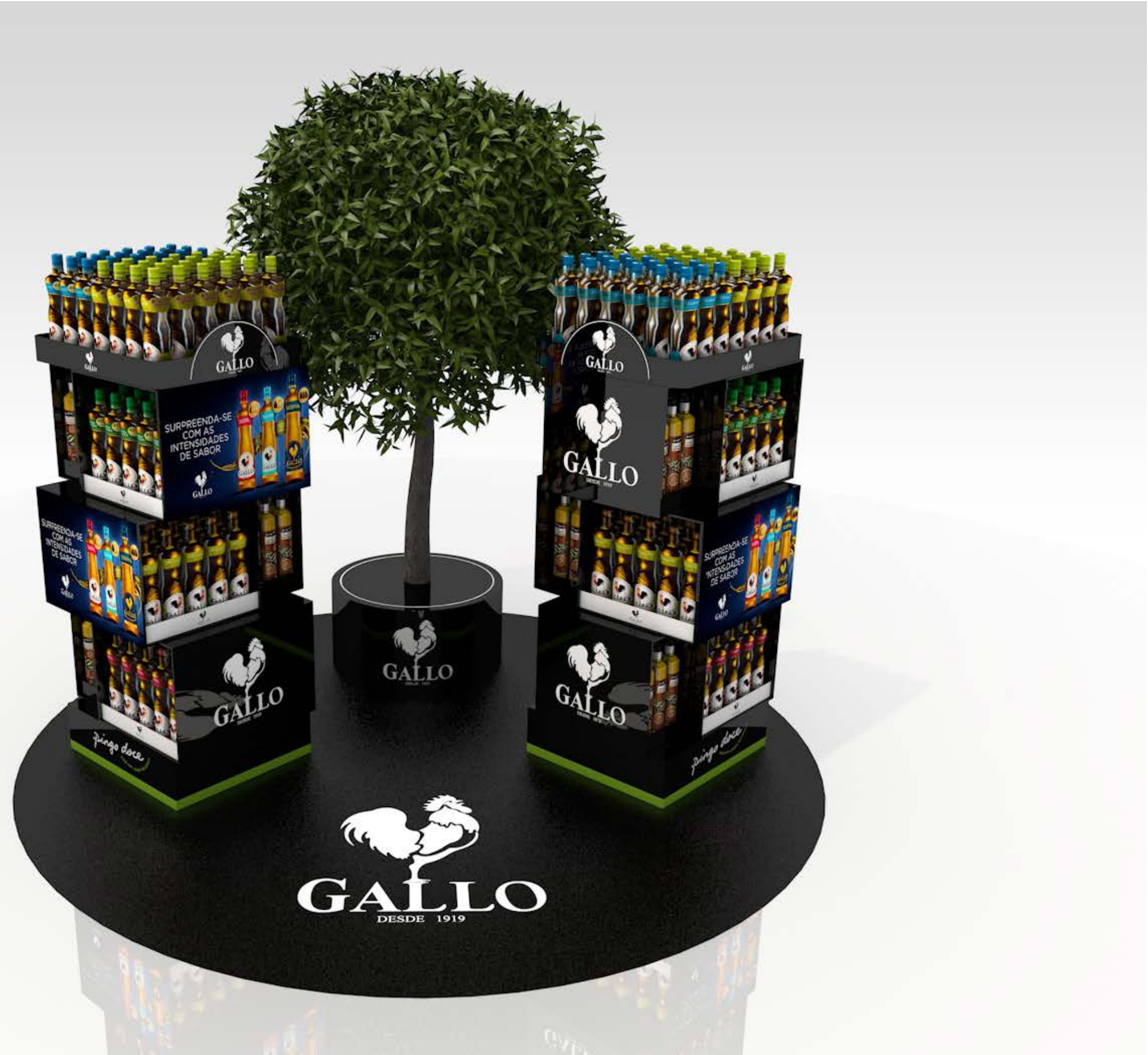
PROJETO Expositores e Ilha Gallo