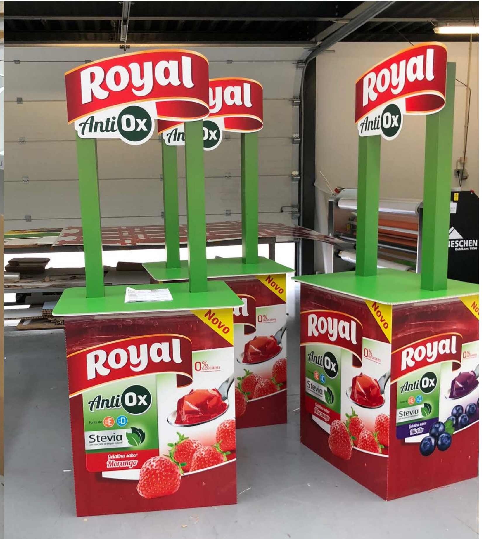
PROJETO Expositor e Bancas Royal