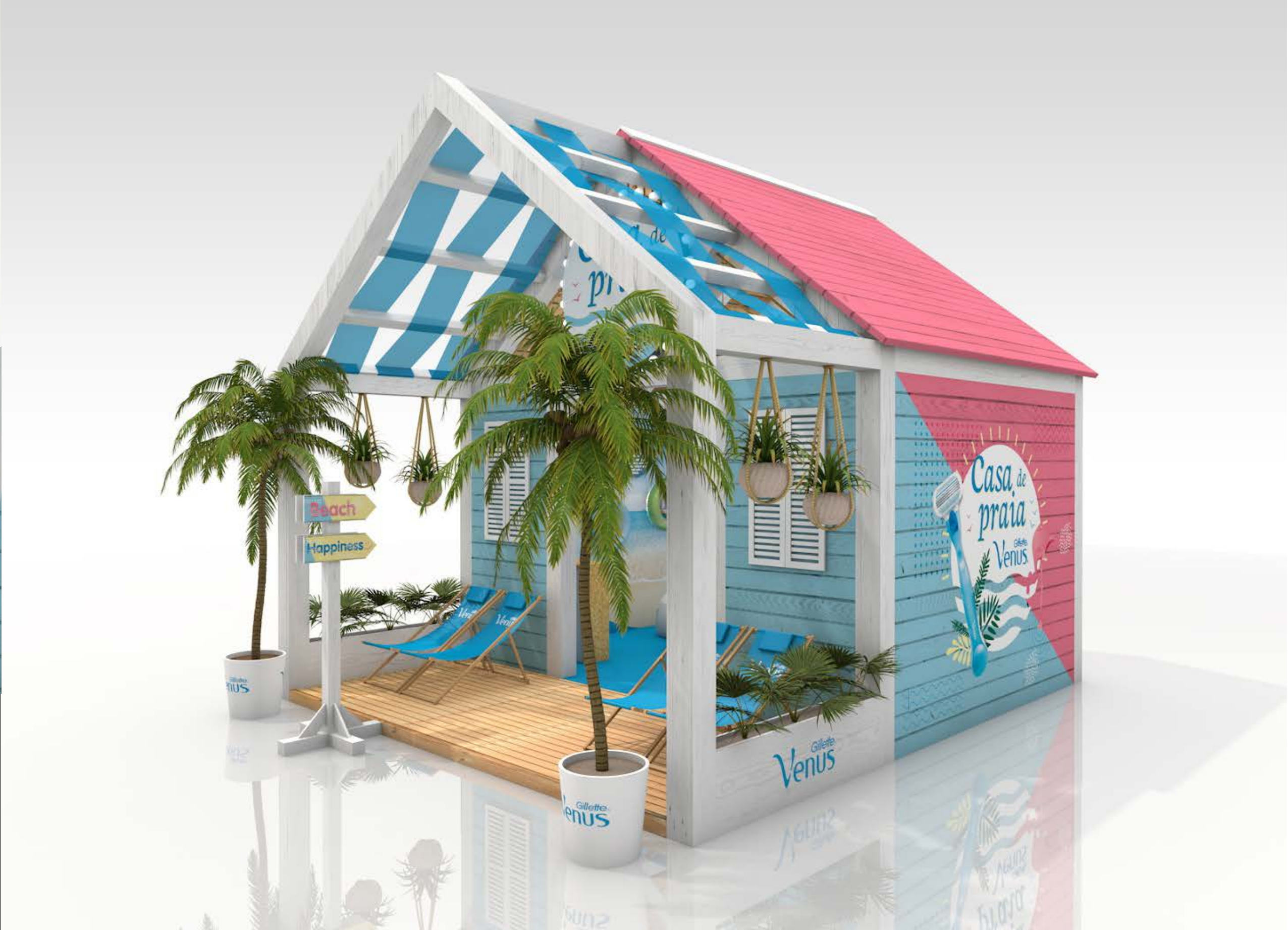
PROJETO Gillette Venus Casa de Praia