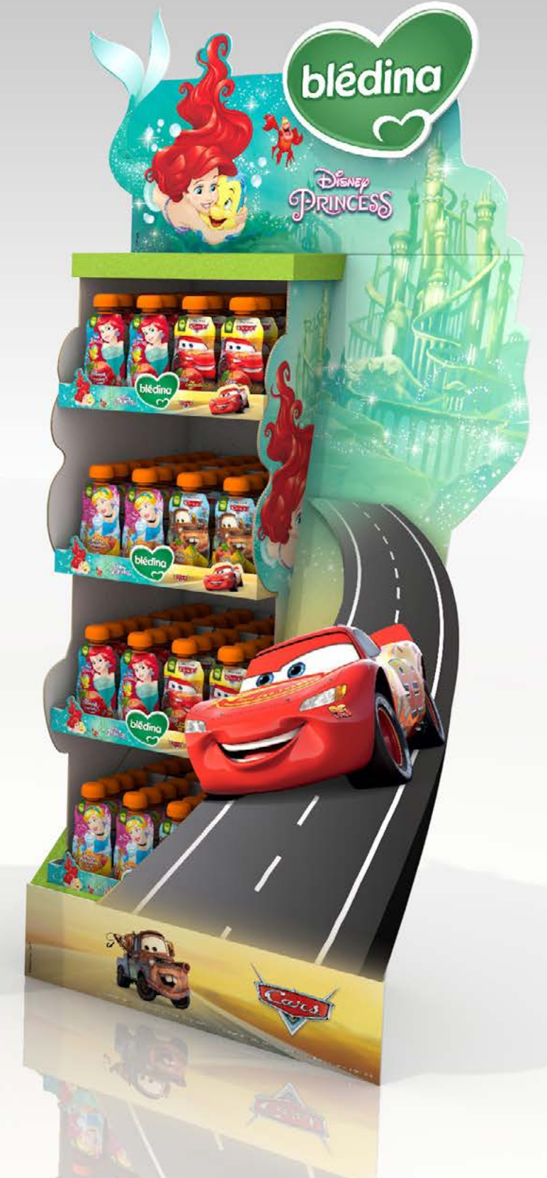
PROJETO Feira do Bebê Blédina Disney _Exposito e Ilha