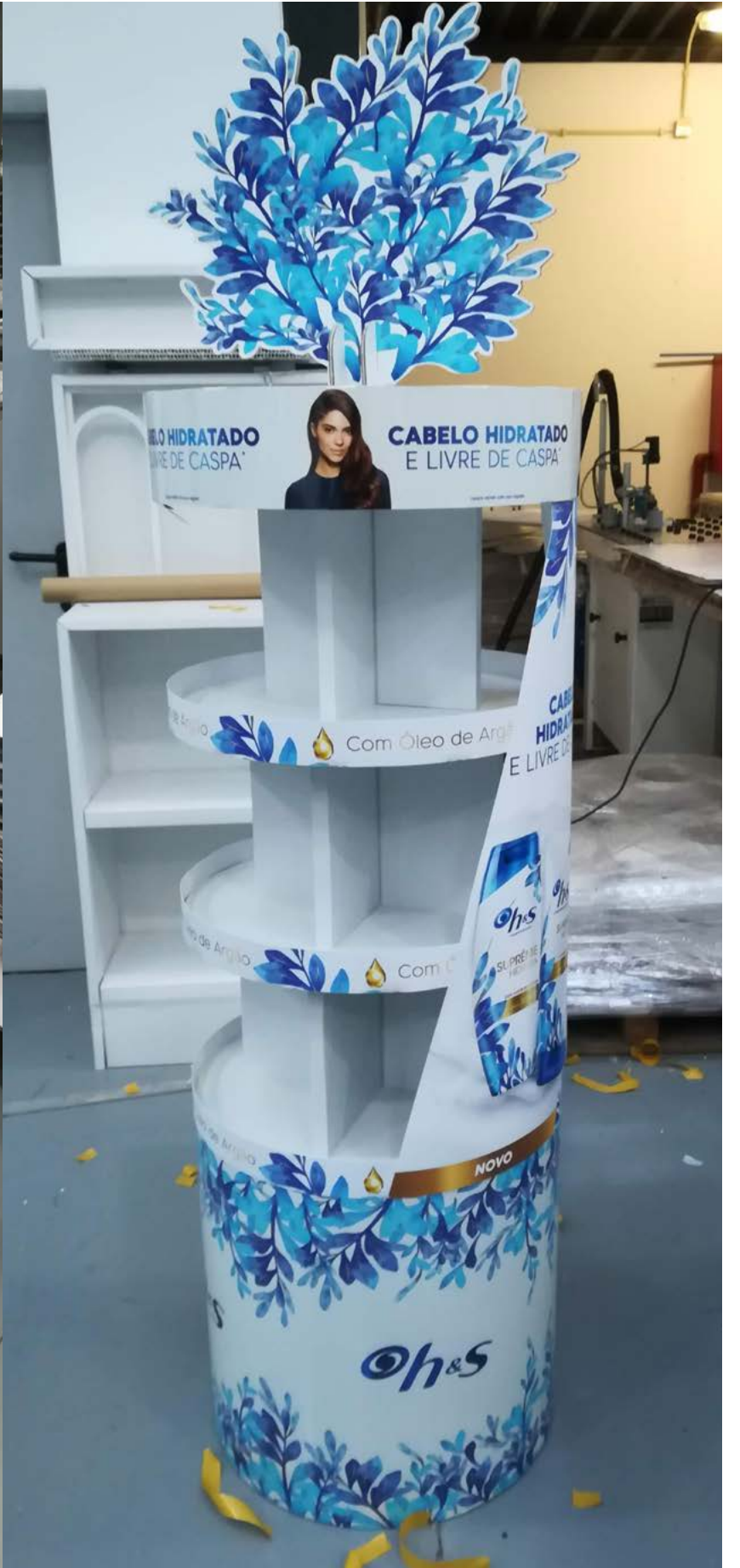
PROJETO Ilhas Ogx e H&S