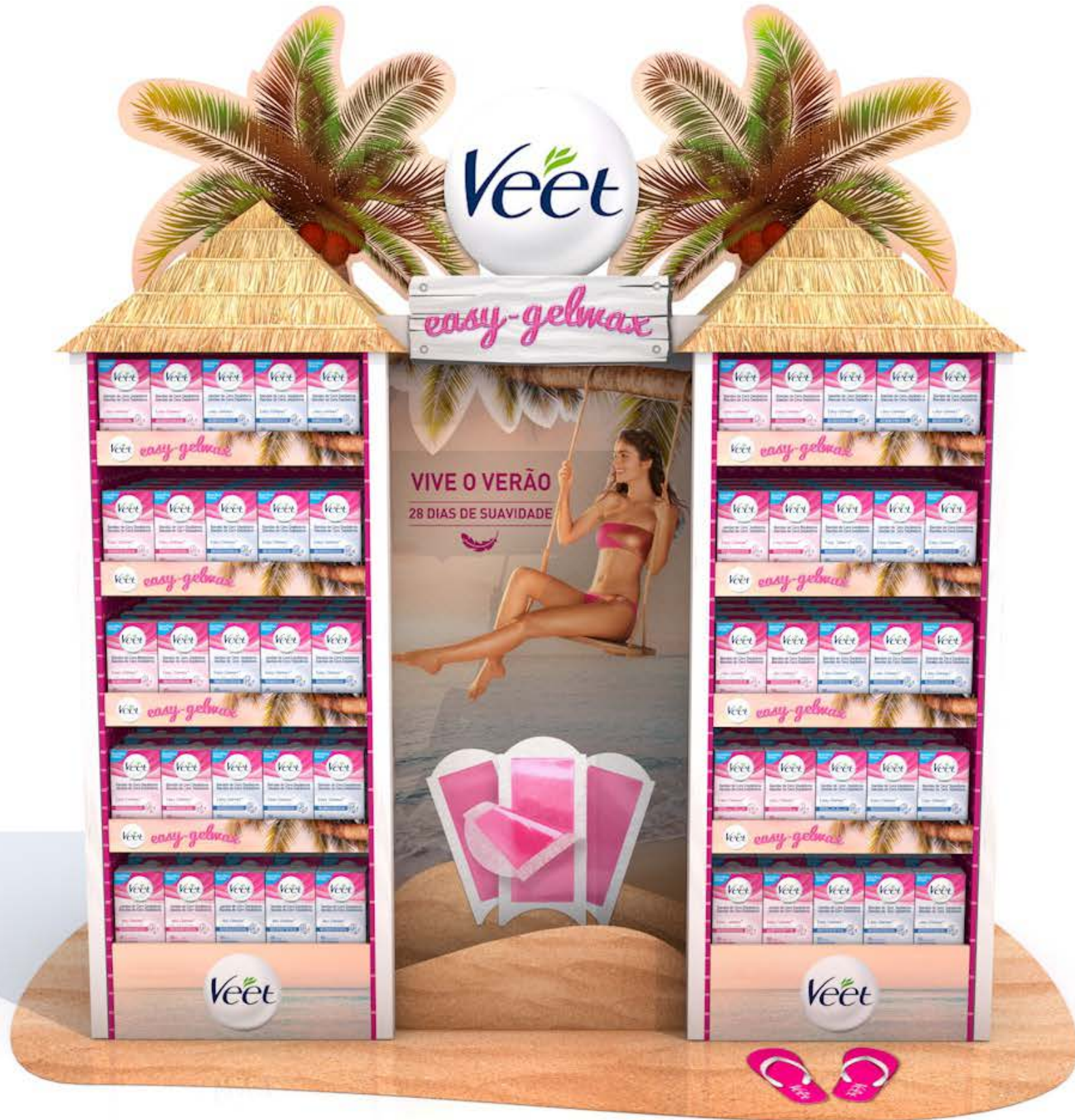
PROJETO Ilhas Expositores Dettol e Veet