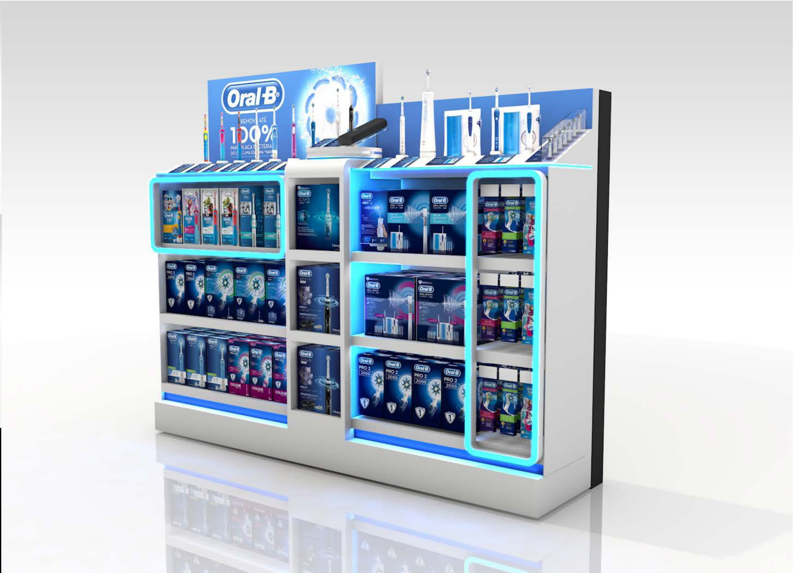
PROJETO Oral B Worten Cascais