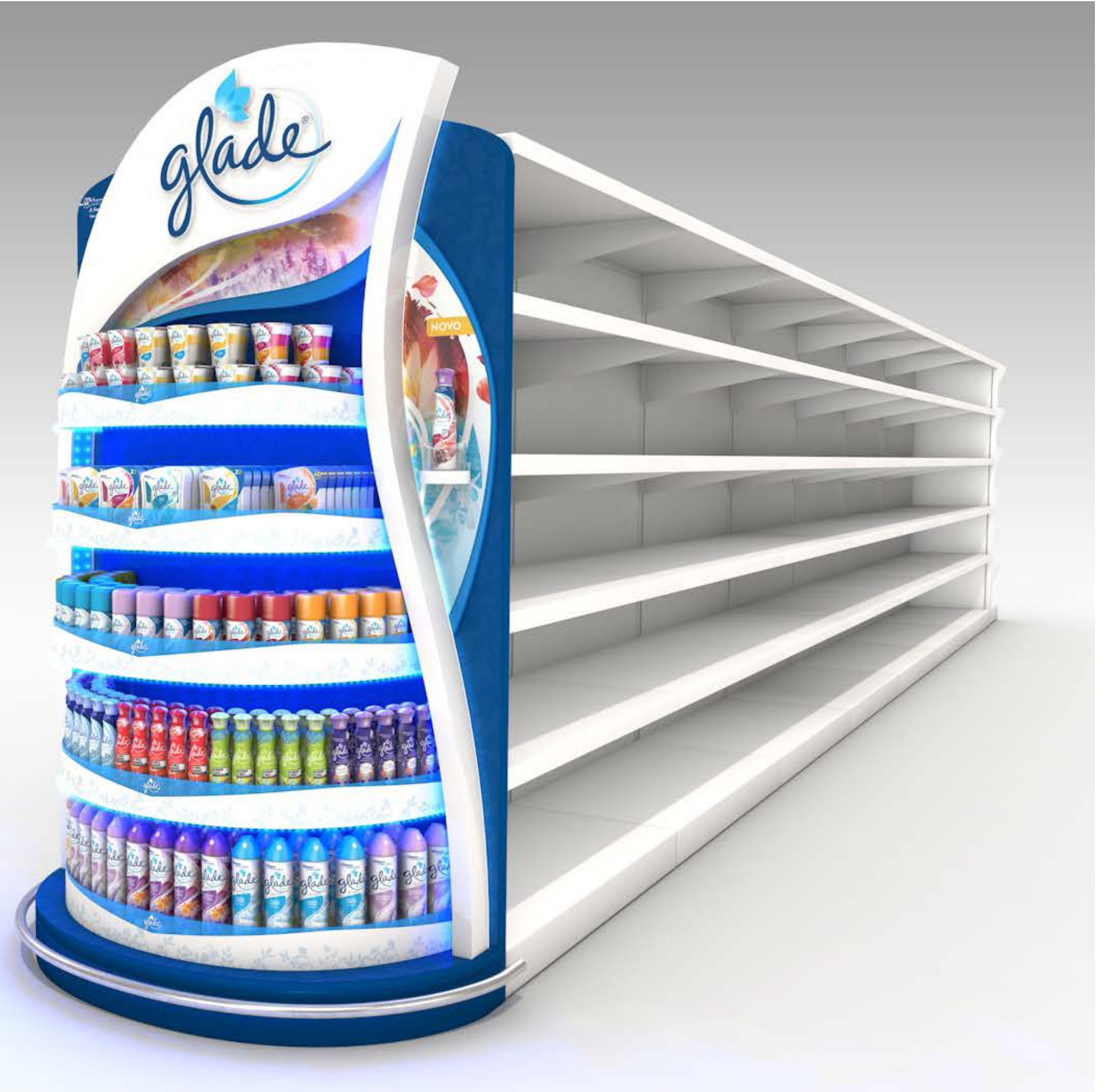
PROJETO Expositores Permanentes