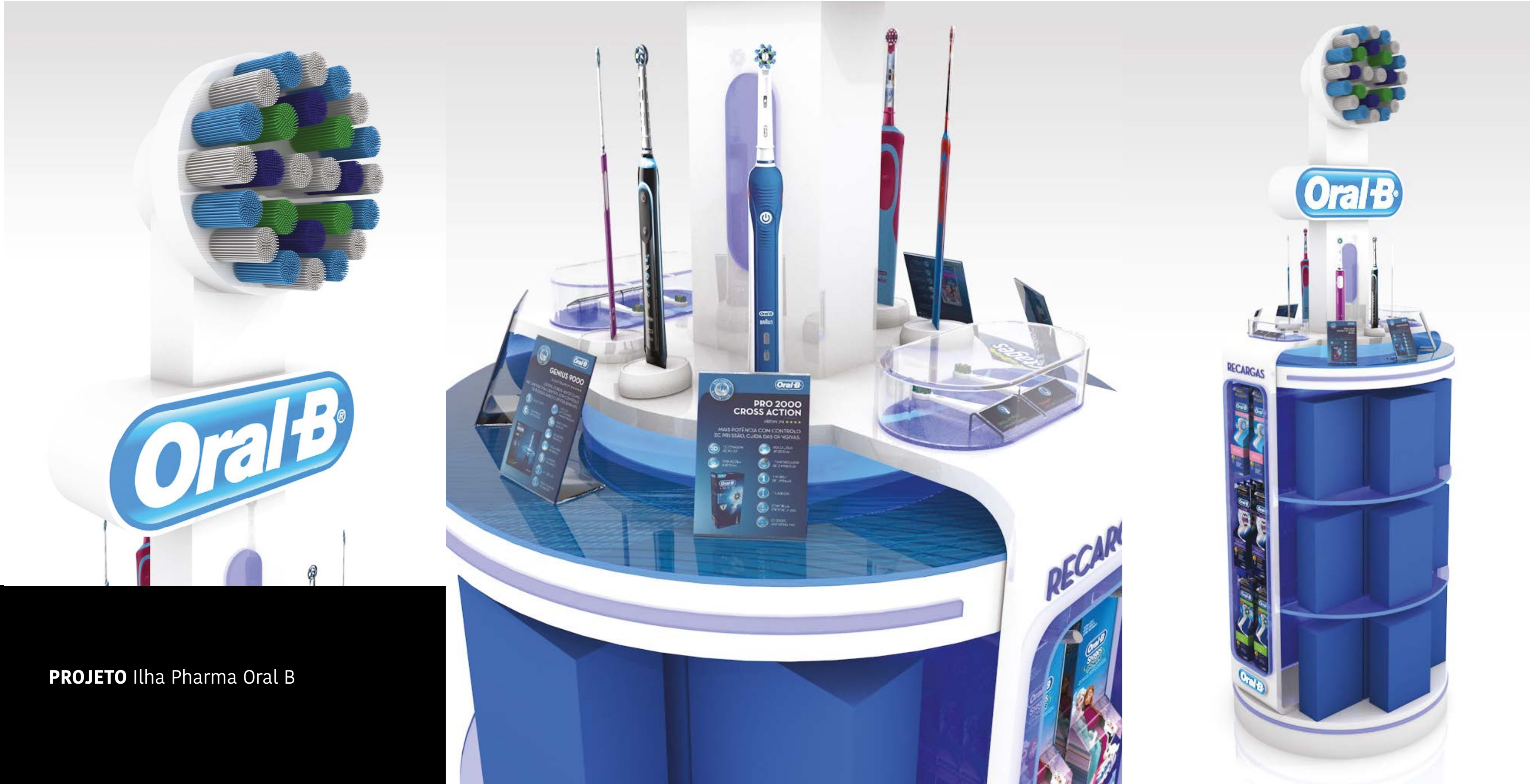
PROJETO Ilha Pharma Oral B