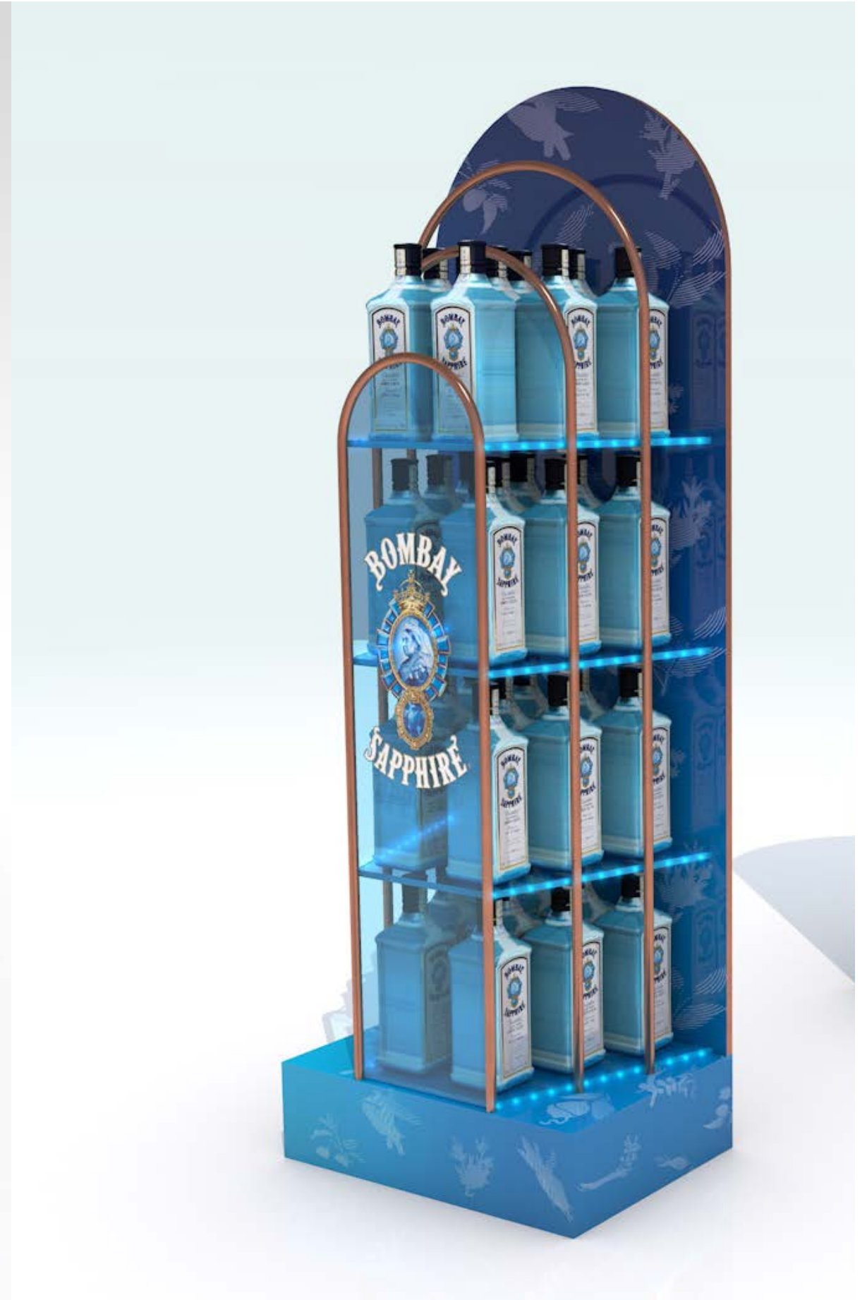
PROJETO Expositores Vários