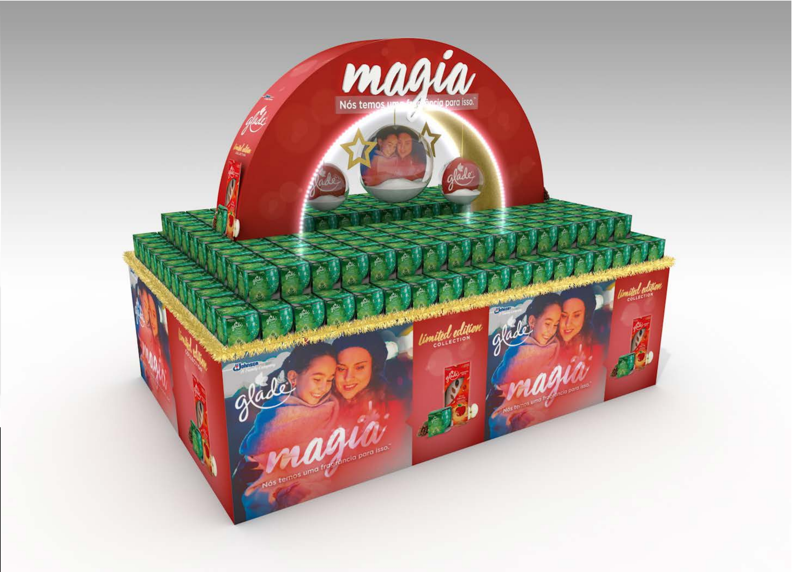
PROJETO Ilhas Glade Natal