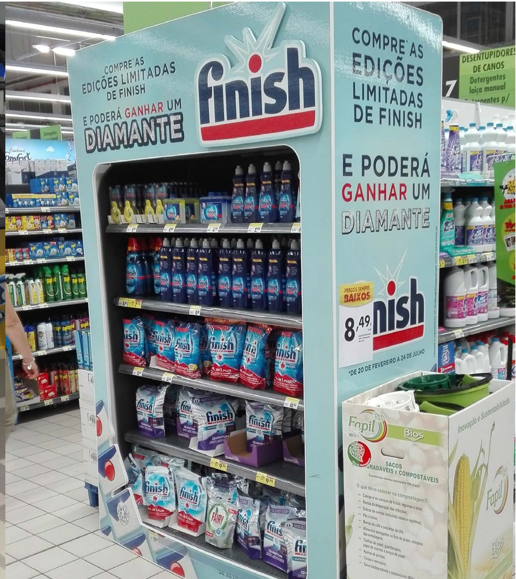
PROJETO Expositores Colgate e Topo Permanente Finish