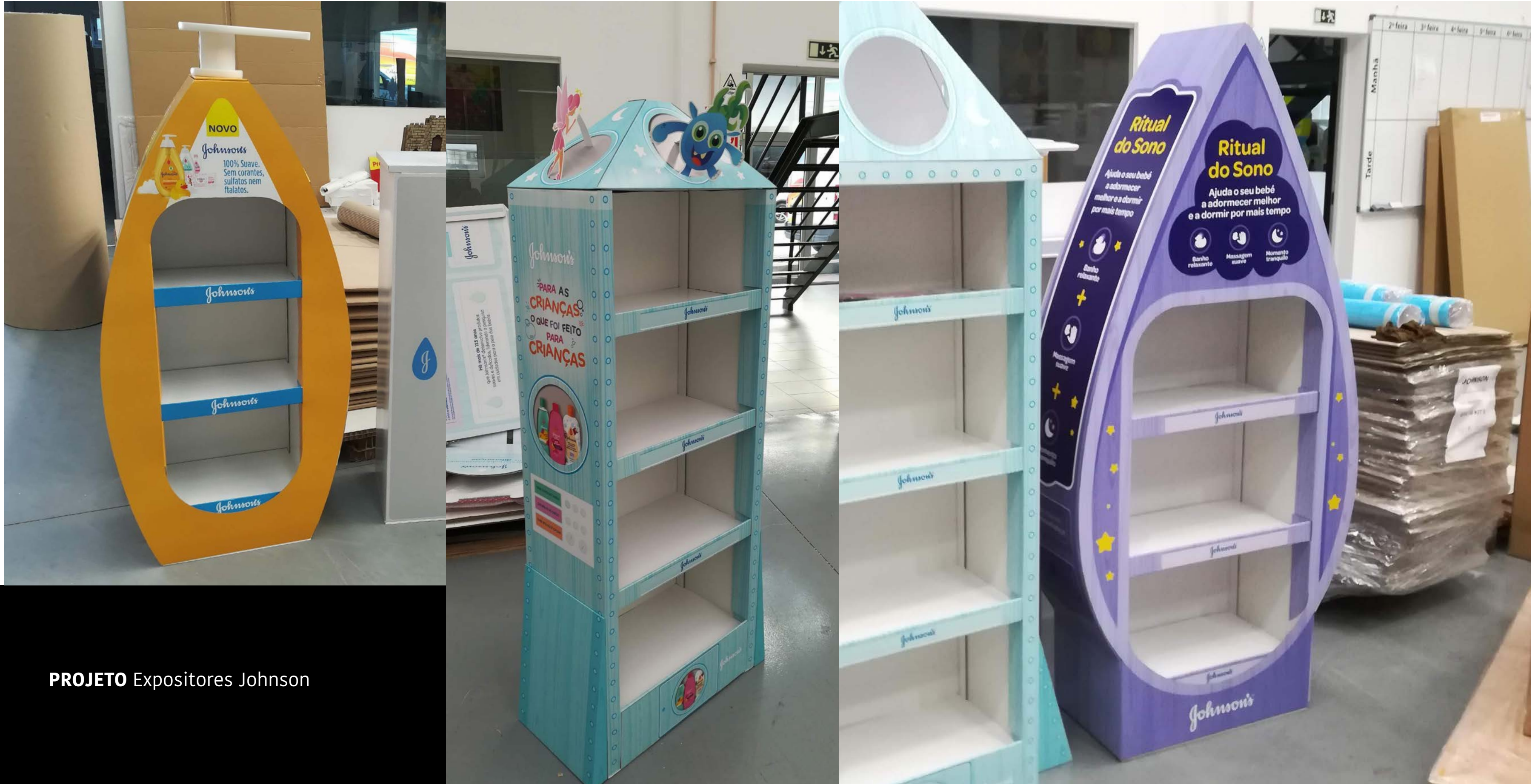
PROJETO Expositores Johnson