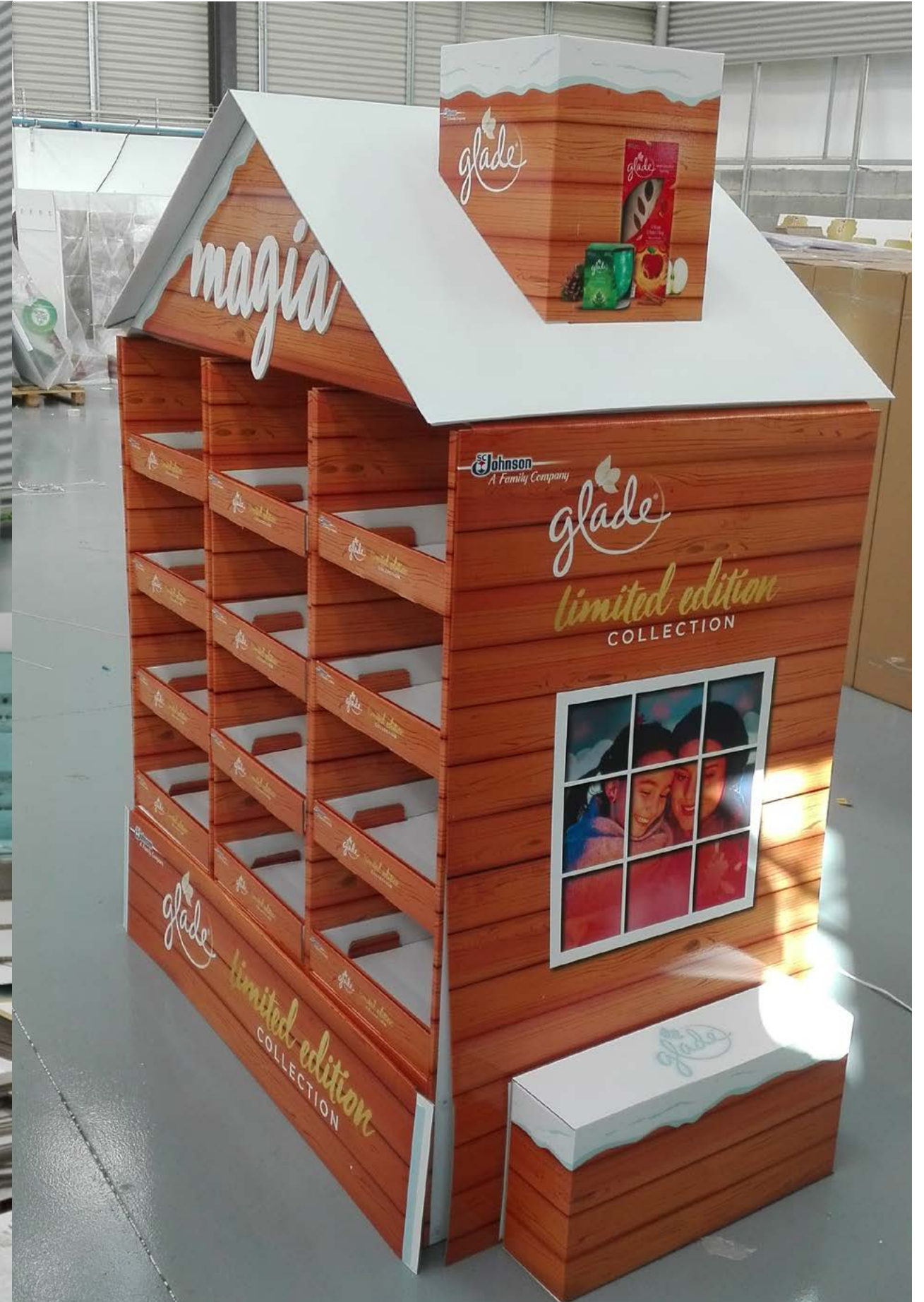
PROJETO Expositor Dodot e Peças Natal Glade