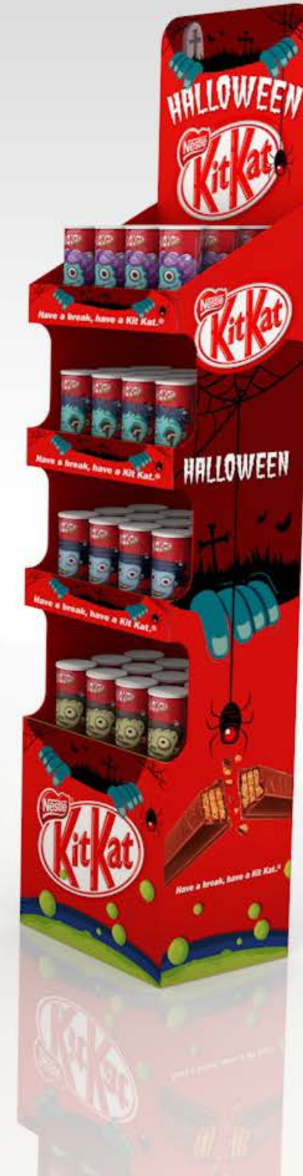
PROJETO Expositores Espanha