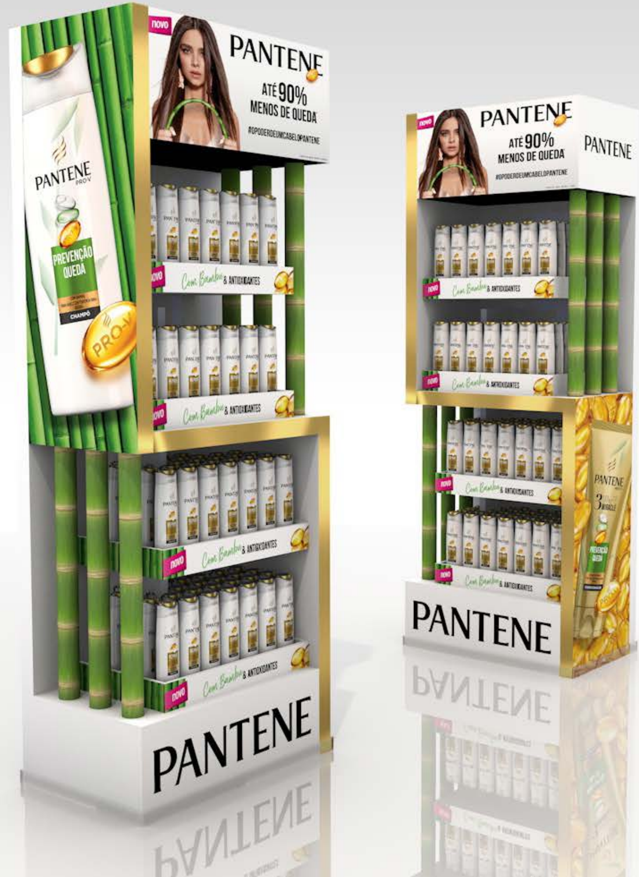
PROJETO Expositores Espanha e Portugal