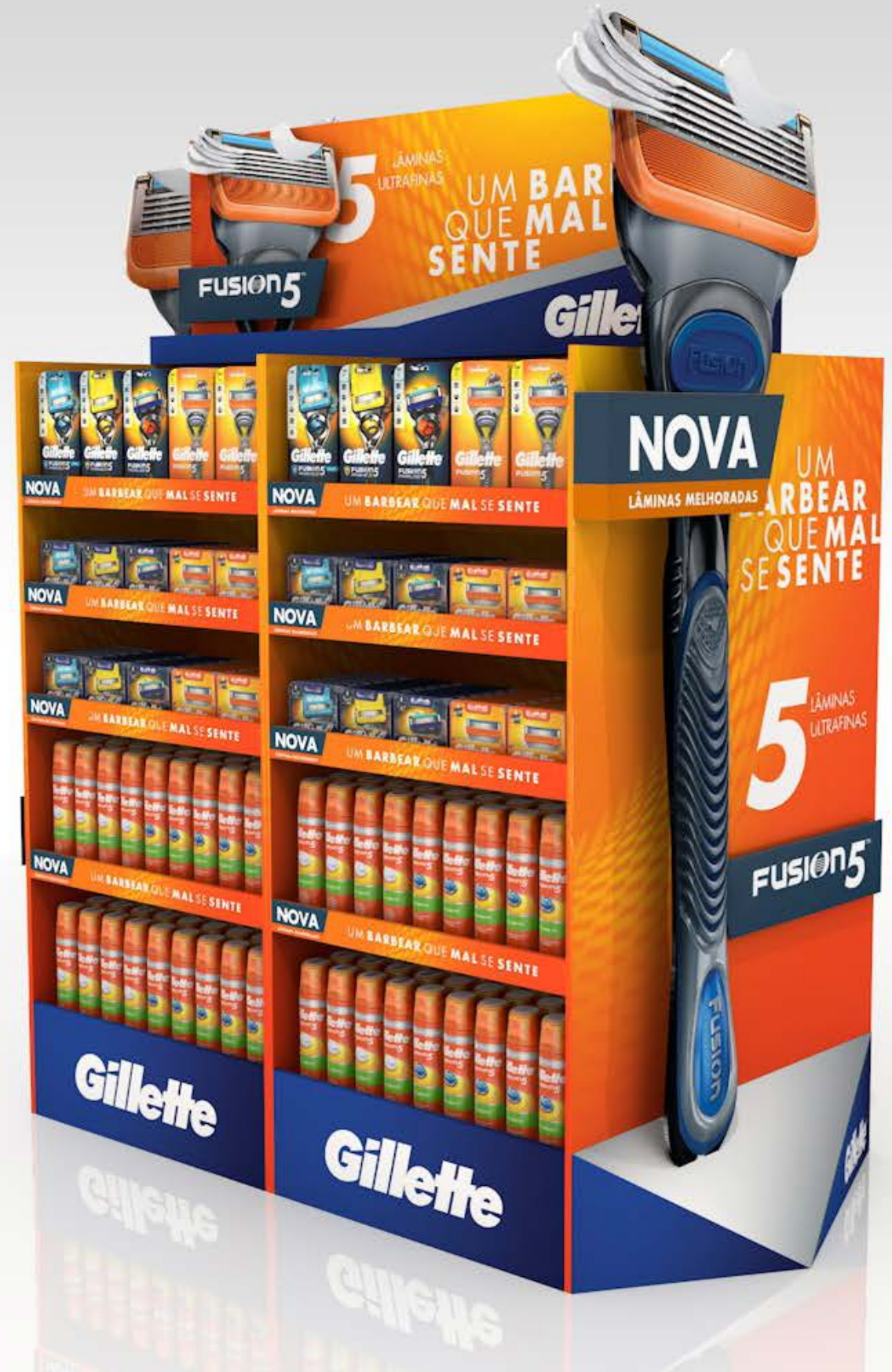
PROJETO Ilha Gillette