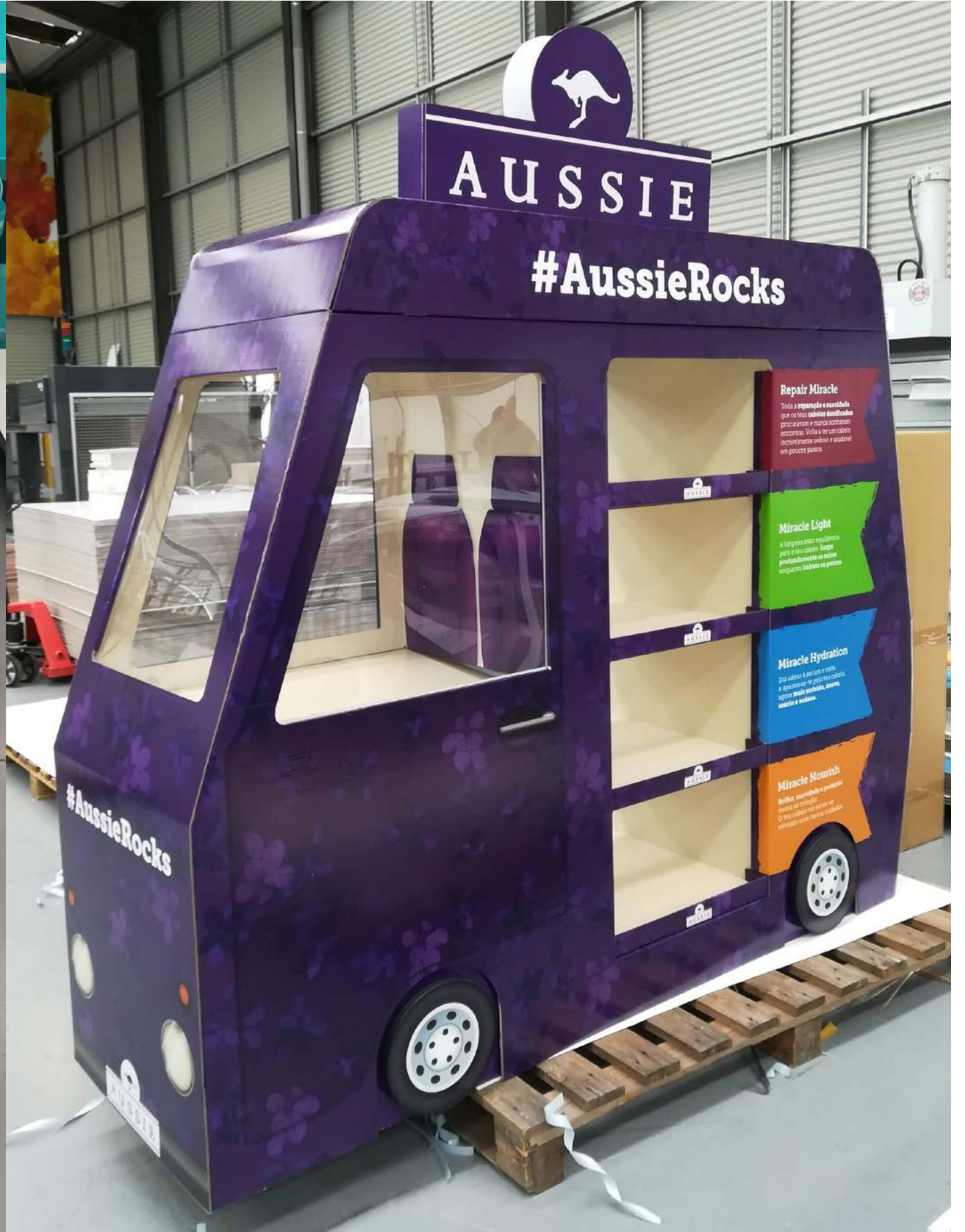
PROJETO Expositores Johnson e Aussie