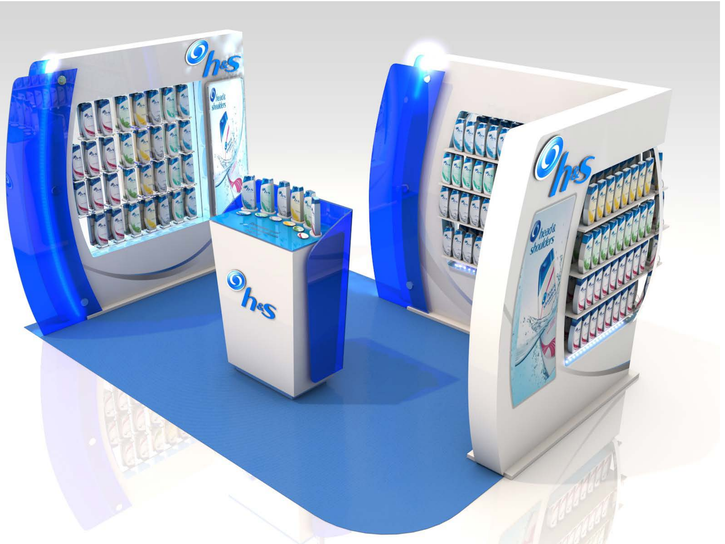
PROJETO Linear e Espaço H&S