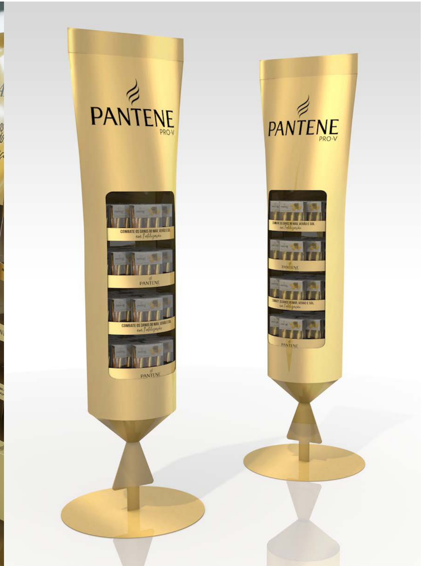
PROJETO Expositores Pantene