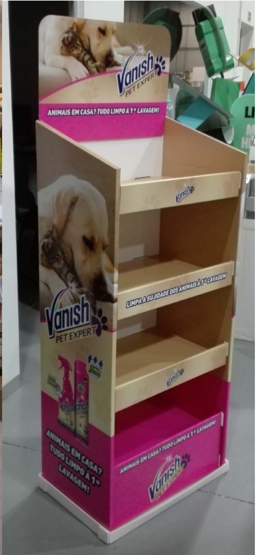
PROJETO Peças Natal Finish e Lipton e Expositor Vanish Pet