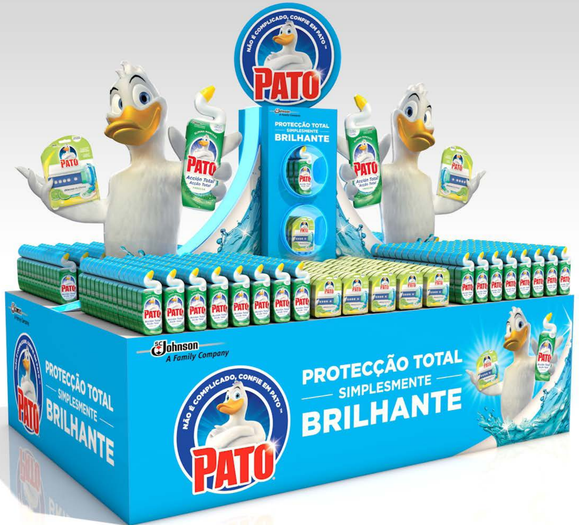
PROJETO Ilhas Pato