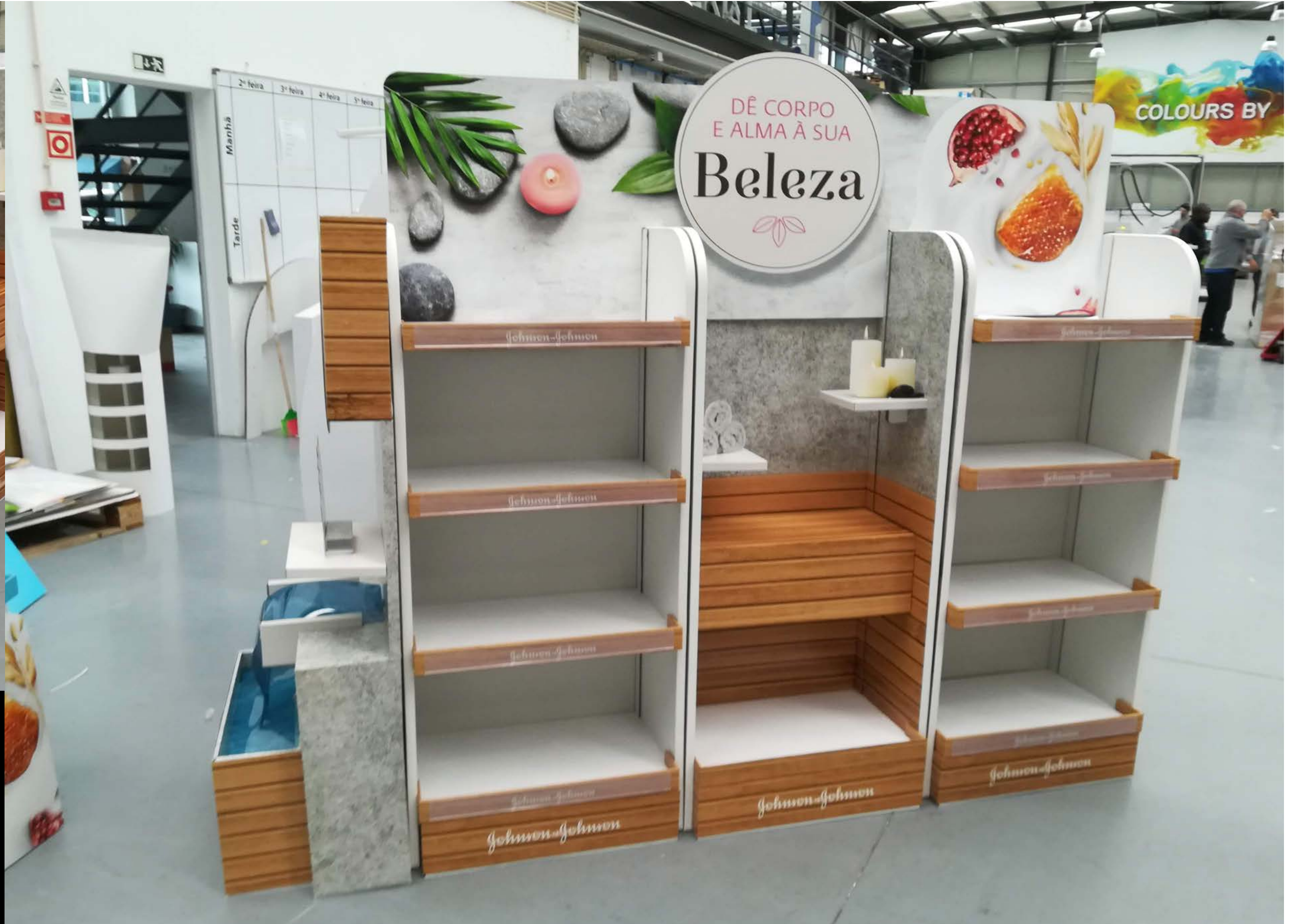
PROJETO Ilha Johnson