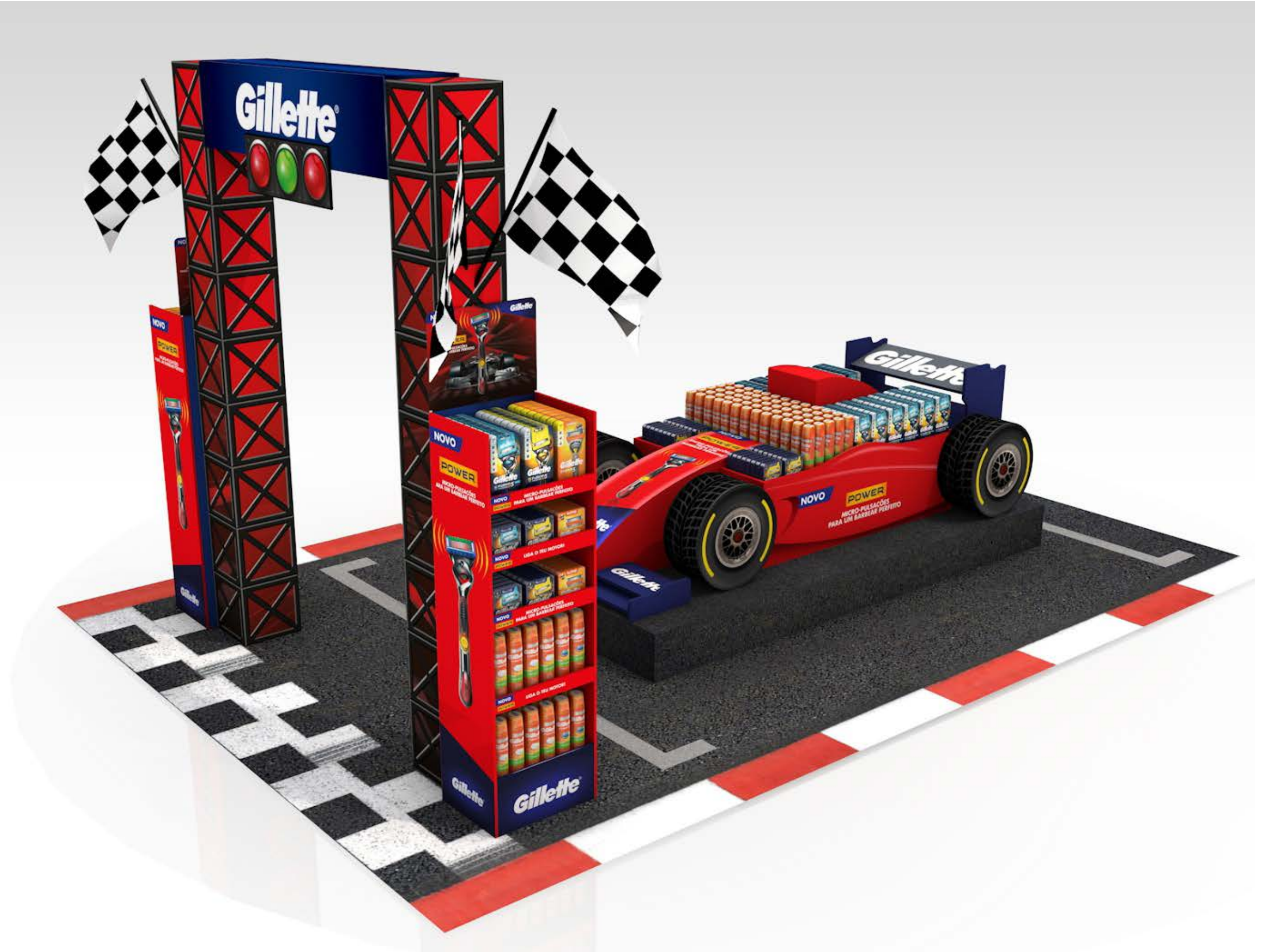
PROJETO Espaço Gillette