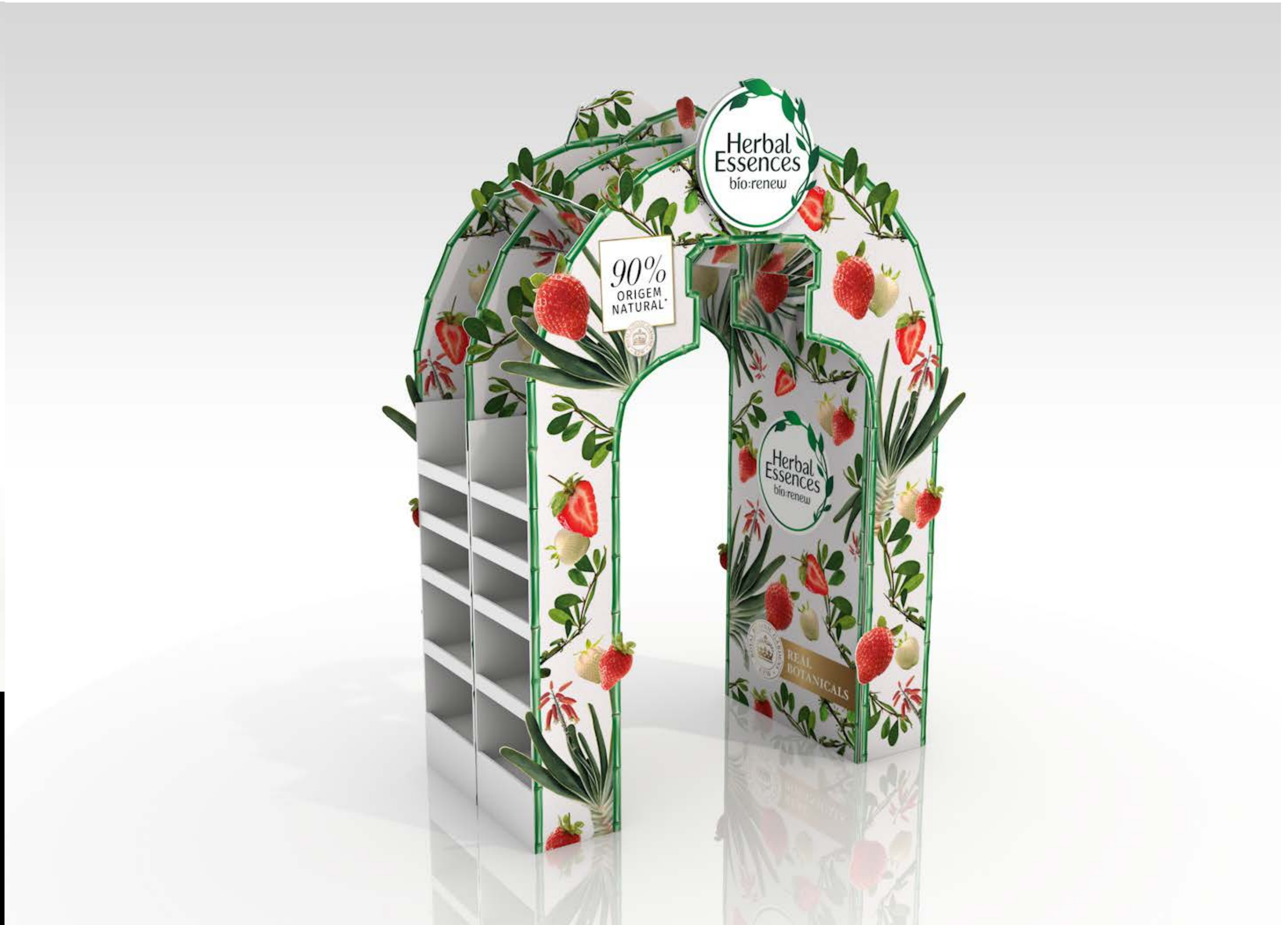
PROJETO Pórtico Expositores Herbal Essences