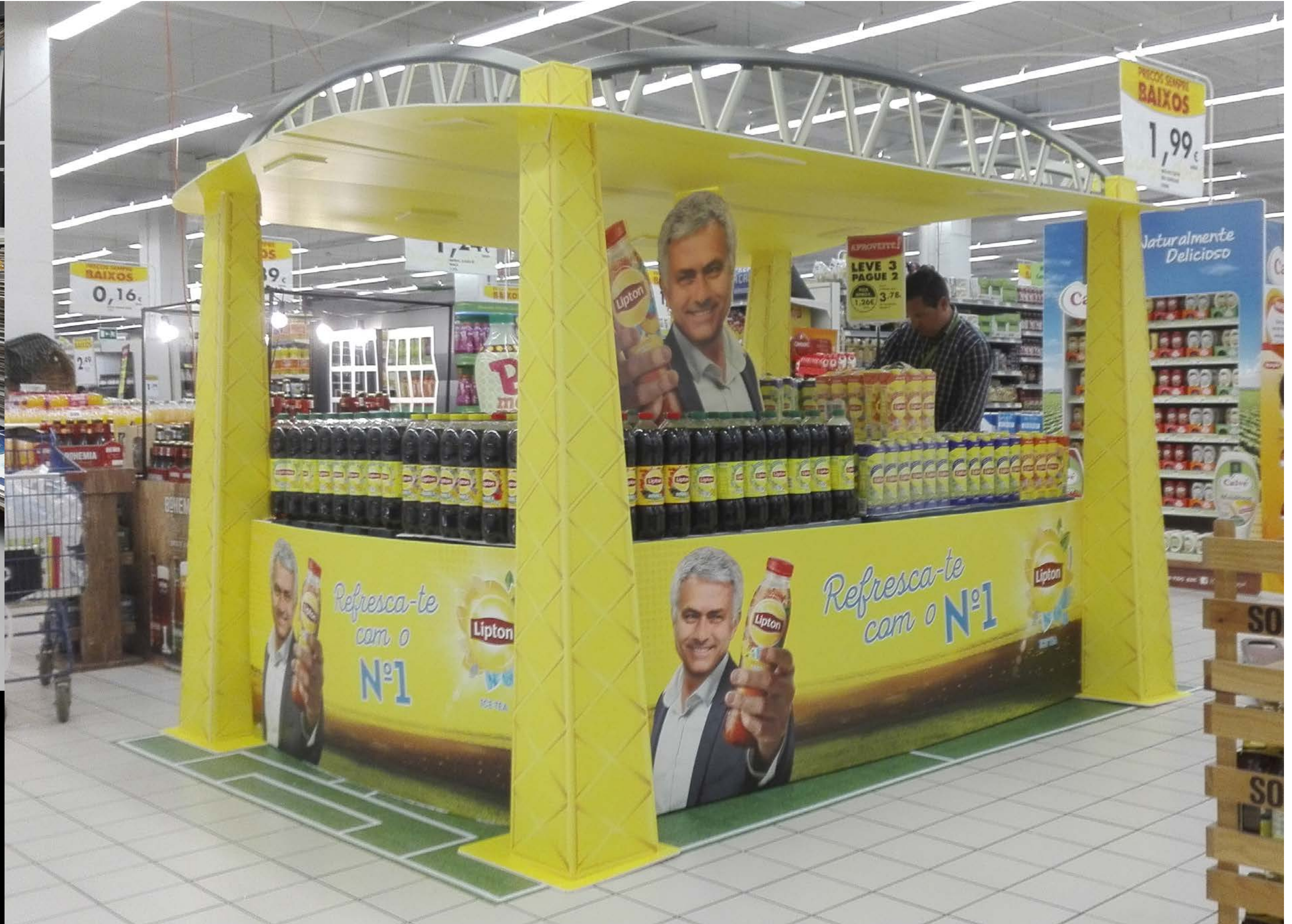
PROJETO Expositor Calgon e Ilha Lipton